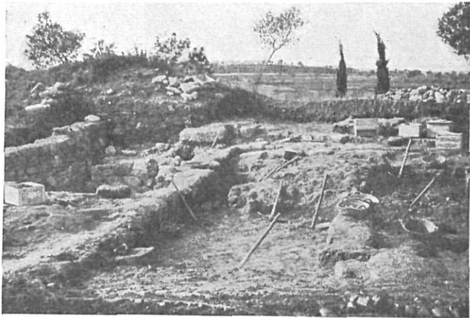
Cortes campo triangular próximos a torre cuadrangular.

Los trabajos del presente año comprenden la apertura de una gran zanja transversal a la muralla Oeste, practicada en el interior del recinto enfrente de donde se halla una torre cuadrangular de flanqueo y que se dirige hacia la vertiente levantina para hallar las estructuras de la respectiva muralla que cierra el recinto superior por aquella parte de la ciudad.