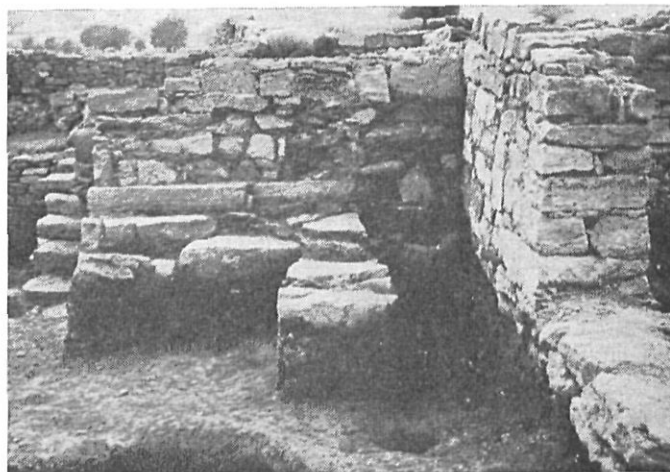
Excavaciones después temporales nieve.

Se hallan en marcha asimismo los trabajos de limpieza, restauración, dibujo y clasificación de la enorme cantidad de material que las recientes excavaciones han exhumado en el poblado prerromano de Ullastret, para dar cuenta de las piezas más sobresalientes en el número próximo de esta publicación.