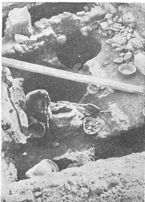
Cortes campo triangular.

que han permitido su restauración total, algunos de ellos con escenas figuradas de temas mitológicas, pertenecientes al estilo de figuras rojas de la segunda mitad del siglo V a. de J. C. y de fabricación ateniense; junto con esas piezas aparece la cerámica vulgar o común de procedencia local que se fecha por hallarse en un momento coetáneo con los aludidos vasos griegos.