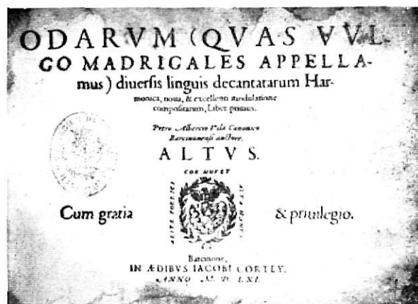
Ejemplar único de los Madrigales de Pere Albert Vila, obra de inapreciable valor bibliográfico, impresa en Barcelona en 1561

Este importante fondo musical, más el legado por Pedrell antes de morir, constituyeron la base