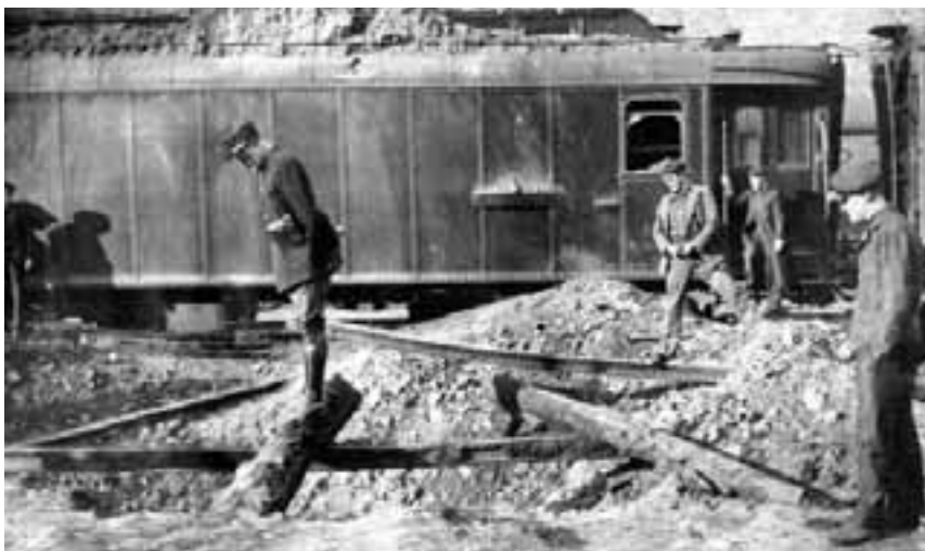
Efectes del bombardeig franquista a les instal·lacions ferroviàries de Cervera de la Marenda, el 26 de maig de 1938.