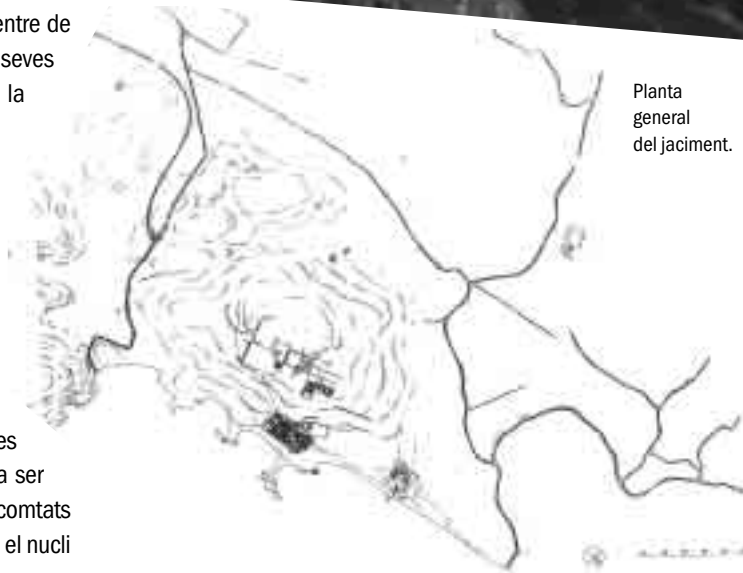
Planta general del jaciment.