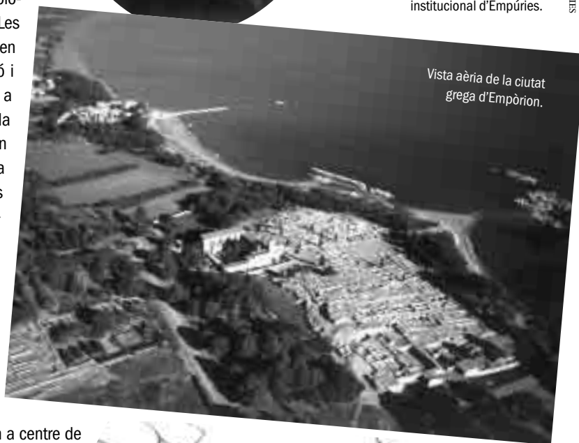
Vista aèria de la ciutat grega d'Empòrion.