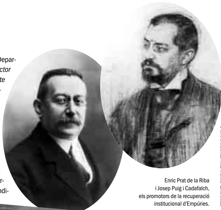
Enric Prat de la Riba i Josep Puig i Cadafalch, els promotors de la recuperació institucional d'Empúries.

El Pla director volia incidir, sobretot, en l'evolució històrica d'Empúries i en la seva imbricació amb el territori, més enllà dels límits administratius actuals del Museu d'Arqueologia de Catalunya-Empúries i més enllà del seu passat grec i romà. Per això, es proposava incorporar en el seu marc d'actuació els períodes històrics anteriors a la fundació de l'empori grec, que només s'entén en el context cultural indígena amb el qual va interactuar, és a dir, els períodes corresponents a l'antiguitat tardana –quan Empúries va ser seu episcopal–, a l'edat mitjana –quan Empúries va ser capital d'un dels comtats francs i després d'un dels primers comtats catalans–, a l'edat moderna –quan des d'Empúries es fundà el nucli