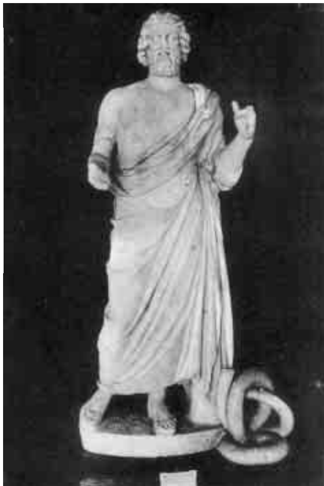
Escultura d'Asclepi, trobada l'any 1909 a Empúries, en una postal del fotògraf escalenc Josep Esquirol.

materials arqueològics d'Empúries, avui dia ubicats en quatre espais diferents i sense cap connexió entre ells, sinó que alliberarà aquests espais actuals de magatzem i permetrà multiplicar l'exposició permanent del museu, crear una sala d'exposicions temporals i donar ubicació als tallers didàctics. El projecte de construcció del nou centre de visitants a l'entrada del conjunt arqueològic, redactat pel despatx d'arquitectura de Fuses i Viader, facilitarà la comprensió del jaciment i també que els 223.000 visitants anuals que rep Empúries disposin d'uns serveis de major qualitat, adequats a les necessitats de la societat del segle XXI. El projecte d'ordenació dels