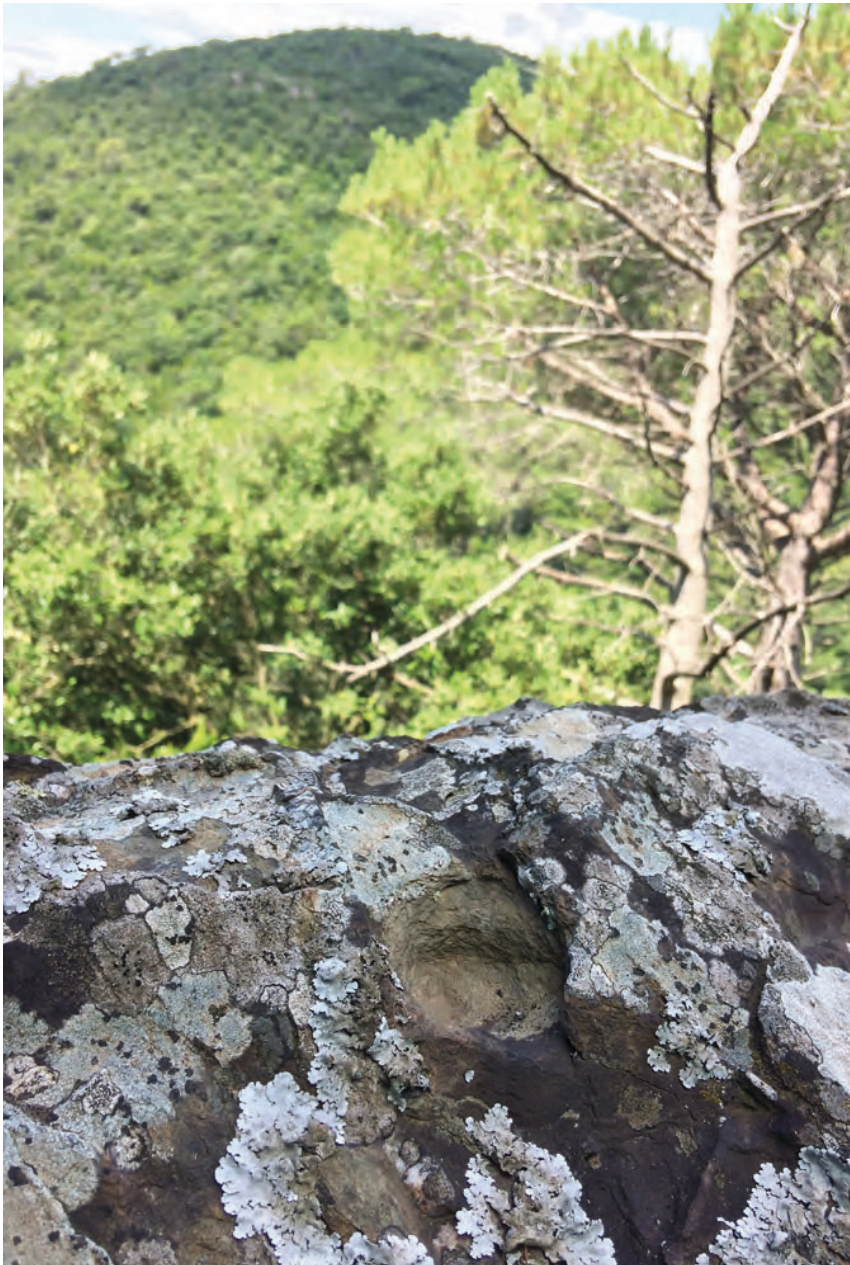
>> Cassoleta única al damunt d'un aflorament rocós en altura. Marques de terme ancestrals?

Si la funció final d'aquests gravats resta, com ja he dit, desconeguda, la seva provenença i evolució posterior tampoc no és que quedi