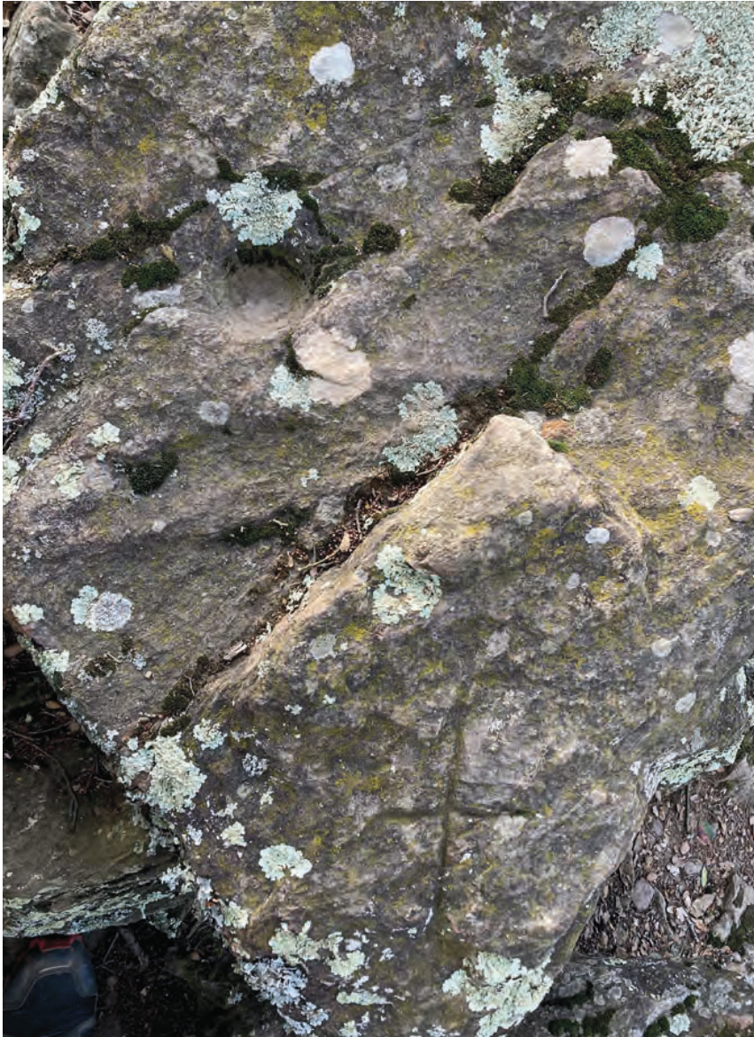
>> Creu llatina gravada al damunt d'una llosa amb cassoletes neolítiques, al terme de Palamós.

gaire clara. A tot el món se'n troben, d'inscultures com les que tenim a casa nostra; fins i tot, de molt més elaborades (espirals, representacions antropomorfes...), cosa que fa pensar, atesa la senzillesa de les que tenim aquí, que aquesta pràctica va arribar a les nostres contrades d'una manera desgastada i residual. L'origen d'aquesta pràctica resulta, doncs, incerta, i les teories són nombroses i controvertides; el que resta inalterable és la morfologia dels gravats i la tècnica amb la qual es van fer, amb l'única diferència de l'eina de pedra emprada en la seva elaboració i la composició de les lloses que hi donen suport, que evidentment varien segons la geologia de l'entorn. La conclusió, doncs, és que naixés on nai-