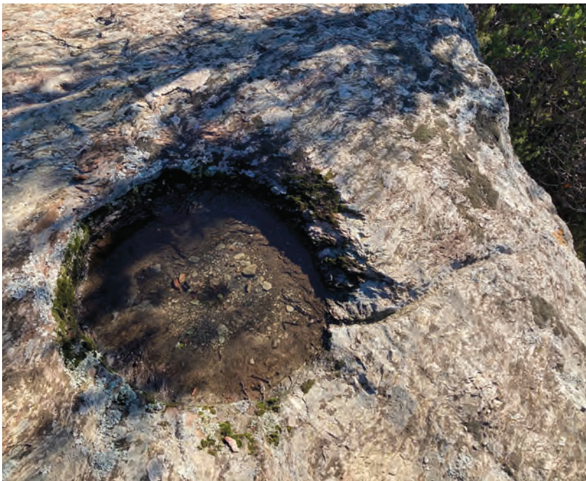
>> Concavitat de més de trenta centímetres, amb un regueró evident, als voltants del mas Torrent de Cruïlles.

Text i fotos > RAFEL CASAS , editor i escriptor