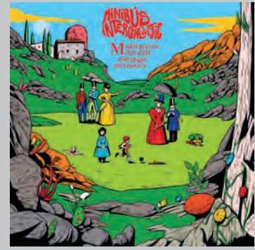
MINIBÚS INTERGALÀCTIC. Meditacions des dels miratges mercúrics . Neu!, 2024. < https://www.instagram.com/minibus_intergalactic >

Meditacions des dels miratges mercúrics ha estat publicat pel segell gironí Neu!, i mostra un grup més elaborat i treballat, però incidint en la mateixa línia argumental i ampliant límits sonors, del rock psicodèlic a tocs lisèrgics, tot recordant també el folk-rock català dels anys seixanta d'inspiració dylaniana, com el «Romanço del fill de la vídua», que han actualitzat i que van enregistrar «Els 3 Tambors» l'any 1966 sobre una lletra de Pere Quart. Com a marca d'inici, el disc s'obre amb «Gos» i un atmosfèric ritme de sitar que toca Vicente Macià, productor del disc. A partir d'aquí se succeeixen nou temes més que se sustenten en unes lletres plenes d'ironia o de conya marinera, com «Drama nacional», en què canten que «carregues amb la derrota