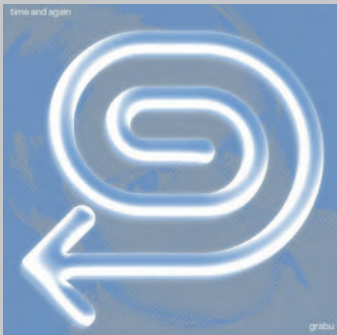
GRABU. Time and again . Picap, 2024. < https://musikk.me/arnaugrabulosa >

des de fa més de cent anys». De menys a més, amb sons d'orgues, guitarres distorsionades, ritme accelerat, fins als més de set minuts de «Roca crua». Pura èpica.