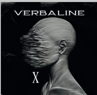
VERBALINE. X. Verbaline , 2024. < https://www.instagram.com/verbaline >