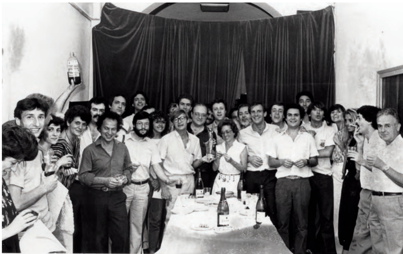
>> Festa de final de temporada de l'antiga RCE a Girona, a mitjans dels anys vuitanta.

La tendència progressiva a emetre una programació feta a distància —Madrid o Barcelona— ha anat ofegant, en alguns casos totalment, la possibilitat de fer una programació lligada al territori com s'havia fet anys enrere