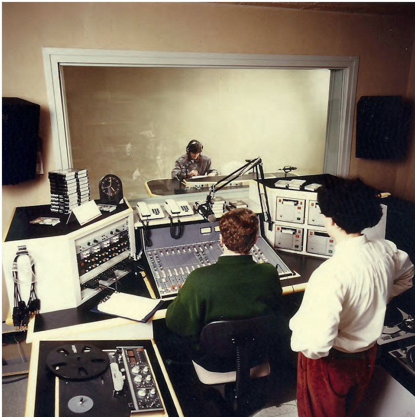
>> Estudis de Ràdio Olot, la primera emissora que va emetre regularment en català. Any 1991.