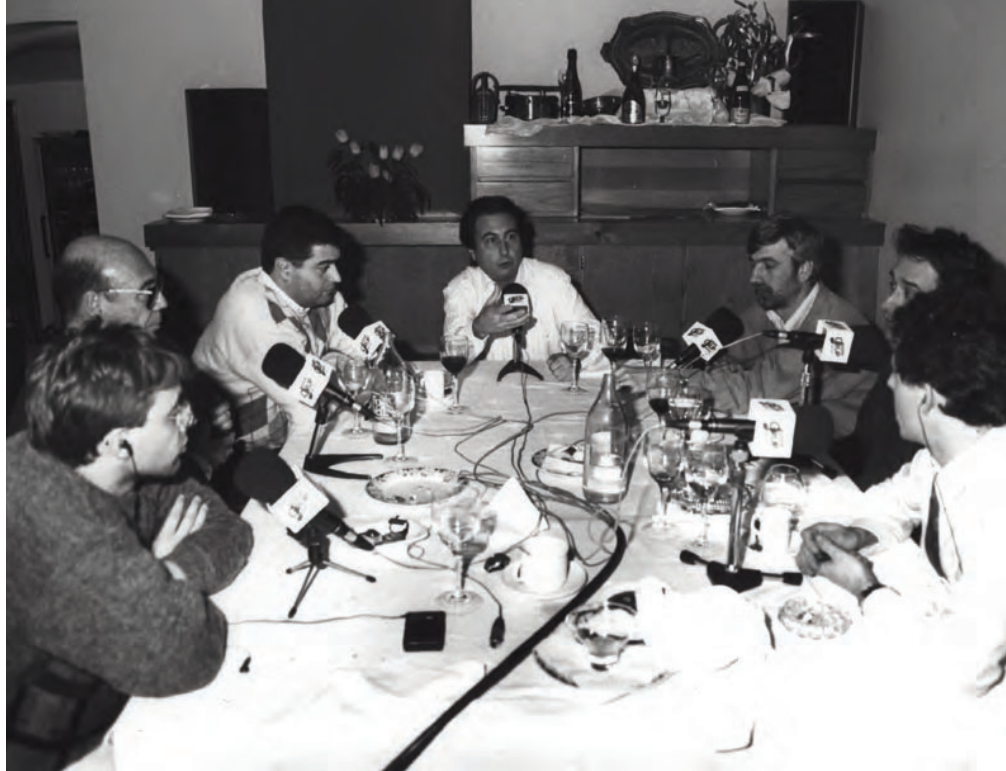
>> Ràdio Grup. Tertúlia «I vostè què hi diu» al restaurant Cipresaia. Girona. Any 1993.