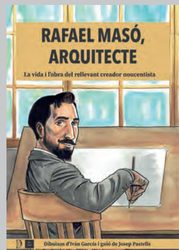
PASTELLS, Josep; GARCÍA, Iván. Rafael Masó, arquitecte . Girona: Llibres del Segle, 2022. 48 p.

Tot i que hi trobem paisatges de moltes ciutats europees, la protagonista de