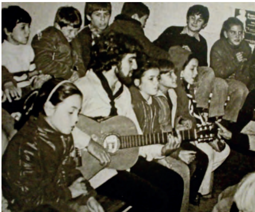
>> Cantant amb els Llops i les Daines del Cau d'Escoltes de Salt, el 1978.