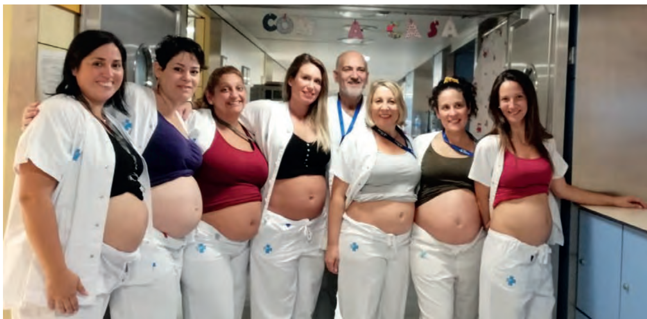
>> Brot d'embarassos al Servei de Neonatologia de l'Hospital Vall d'Hebron el 2019.

En els trenta anys que fa que em dedico a la medicina de nounats, la ciència ha avançat moltíssim, tant en el diagnòstic com en les expectatives de supervivència i en les seves condicions. Però, al mateix temps, hem aconseguit revolucionar el lloc de la família en el procés terapèutic. Ja de jove ho tenia clar: la mare és la mare. Fa trenta anys, el cas d'en Josep, un nen d'un poble del Pirineu molt malalt del cor, i la manera com la mare i l'àvia van viure l'ingrés i l'angoixa del procés, em va fer replantejar les visites familiars dels nens molt malalts. En aquell moment no es preveia que la mare pogués entrar a la sala del nen i agafar-lo en braços quan es moria. Ara això és una pràctica habitual. El cas d'aquell nen de Boira va ser l'inici del treball per humanitzar aquestes situacions límit. I el que vam compartir amb aquella mare i aquella àvia, encara avui és ben viu, i ho hem pogut recordar fa poc temps, en una retrobada. Són records per a