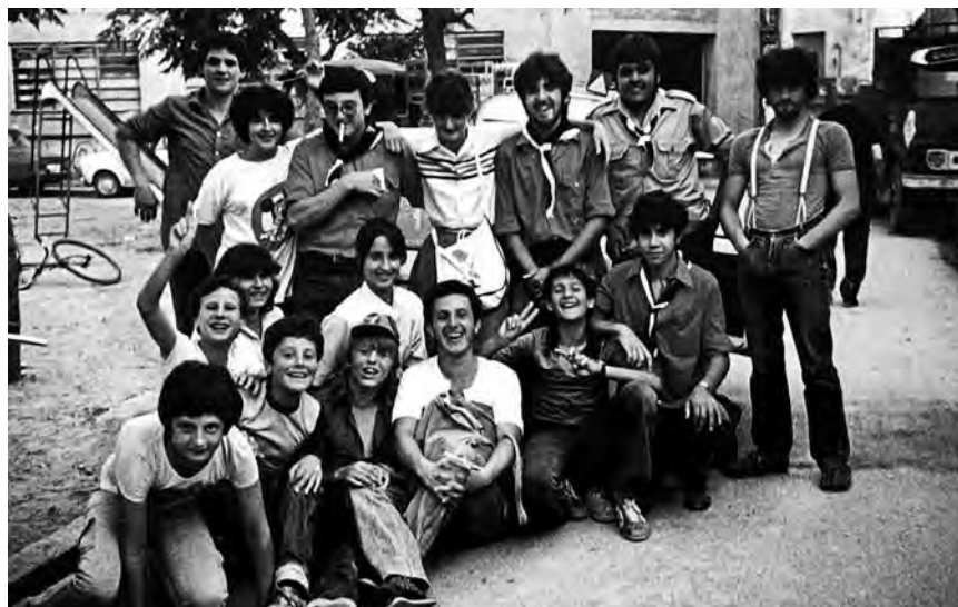
>> Germanor amb els Pioners de Salt, el 1977.