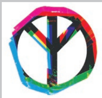
XEBI SF. Hola Elefante . Neul!, 2022. < www.xebisf.bandcamp.com >