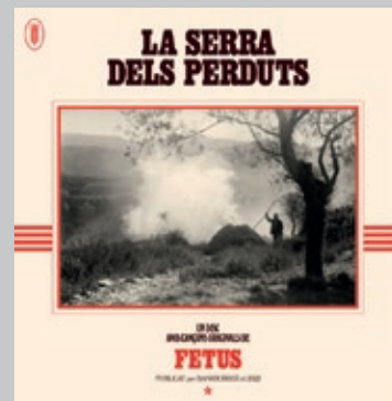
FETUS. La serra dels Perduts . Bankrobber, 2022. < www.facebook.com/ElFetus >

pia, llevat d'«Isabel Cinc Hores», un tema tradicional que fa referència a Isabel Vilà, la primera sindicalista catalana i protagonista del Foc de la Bisbal. Al trio s'han afegit per a aquest disc l'acordió diatònic de Carles Belda i el sac de gemecs de Ricard Ros, en una obra marcada pel ritme, la música directa i la reivindicació.