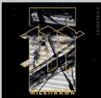
MILENRAMA. Asimétrica . Propaganda pel Fet, 2022. < www.milenramahcpunk.com >

El seu punk-rock estilístic ha eixamplat lleugerament les fronteres, s'ha apropat al folk i ha recuperat algunes històries de la tradició, com l'àlbum «Serra dels Perduts», on adapten una cantata popular, o «Carboner, bon carboner», «una oda a l'ofici i a aquesta vida perduda»