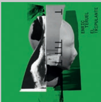
ENRIC TERUEL. El tripulante . Oigovisiones, 2022.