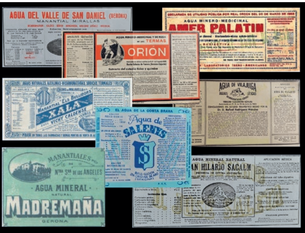
>> Etiquetes de les ampolles d'aigües carbòniques de les marques més antigues.

El nostre territori no va quedar al marge del boom dels balnearis, ara fa més de cent anys. Es varen construir edificis de banys i instal·lacions hotel·leres. A la primera meitat del segle XX, a Catalunya hi havia gairebé una quarantena d'establiments balnearis. Entorn seu, l'auge del turisme va propiciar l'edificació de segones residències