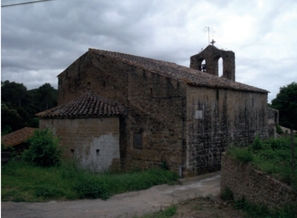
>> L'església de Sant Llorenç de les Arenes, on a partir de 1236 es documenta una comanda hospitalera.

ça dolenta, però que podia passar com a bona per a altres persones que també desconeguessin el context del segle XII, com per exemple va passar amb els notaris i el jutge de Sant Jordi Desvalls que, en el segle XVI, copiaren el text, el signaren i donaren fe d'un document fals que per a ells era vertader.