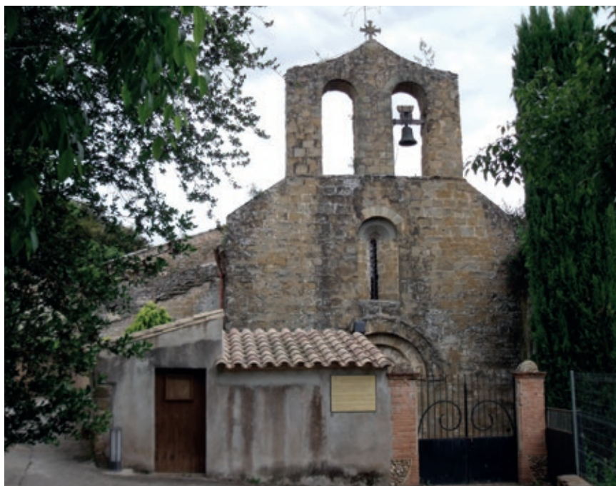
>> Façana de l'església de Sant Llorenç de les Arenes, on hi havia una comanda de l'orde de l'hospital de Sant Joan de Jerusalem.

Per tant, podem dir clarament que el document és una falsificació feta entre 1481 i 1521 en la qual hi ha una barreja d'elements que van des del segle XII fins als inicis del XVI, i que indiquen que els malfactors desconeixien força el context dels documents redactats a inicis del segle XII. És per això que, des del punt de vista d'un expert en diplomàtica (ciència que estudia els documents manuscrits), és una imitació for-