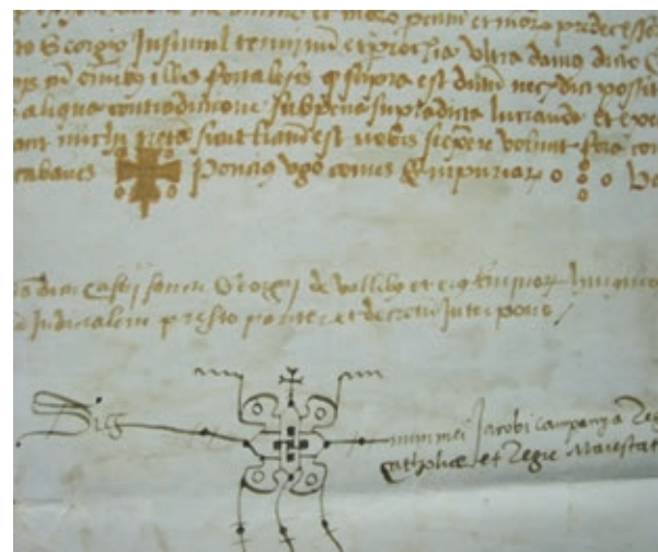
>> Part final del document, on apareix la signatura d'un dels notaris que va fer la còpia.