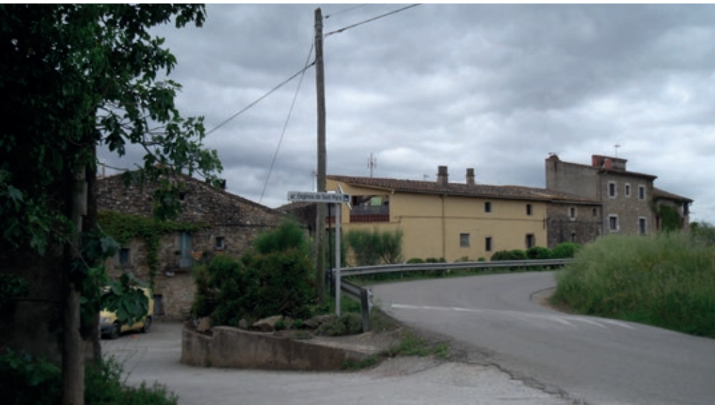
>> Veïnat de Sobrànigues, on suposadament el comte Ponç Hug d'Empúries tenia propietats.

(i la comanda). També dona als monjos hospitalers el dret de transportar i vendre sal per tots els dominis del comte.