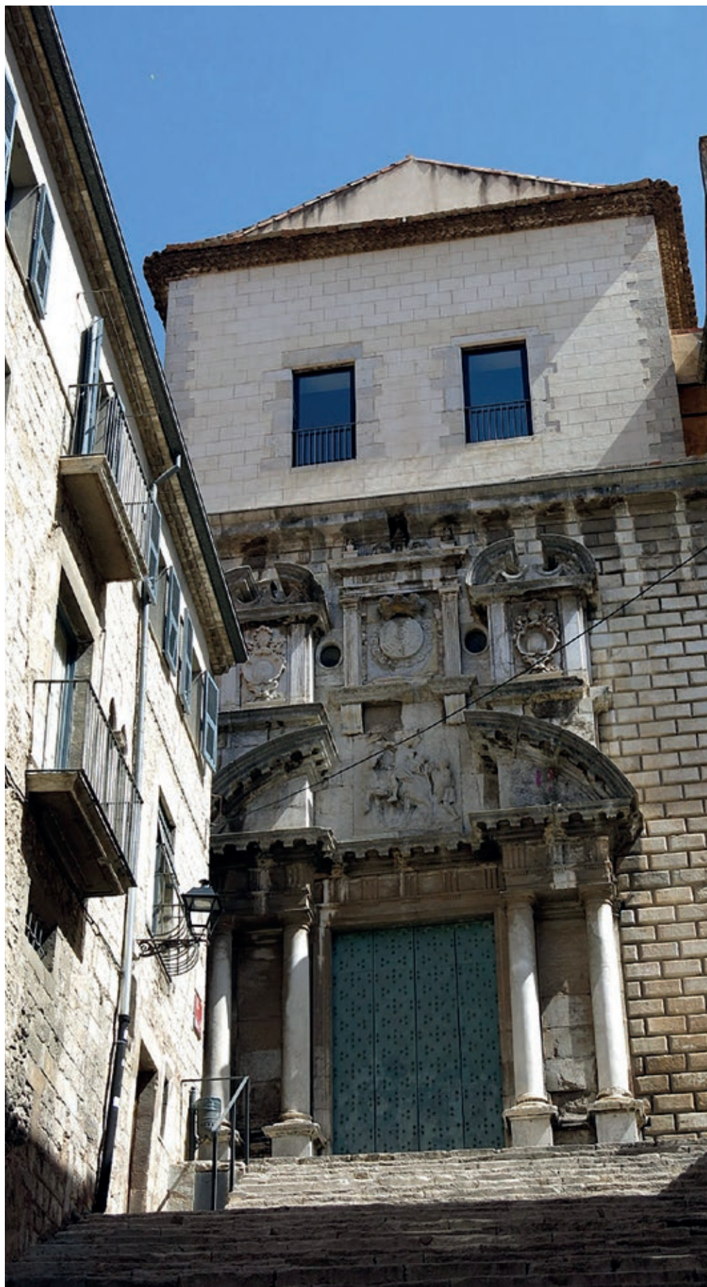
>> Façana del seminari de Girona.

Fou un autor polifacètic i prolífic, que fregava la grafomania; aplegar i difondre el conjunt de tota la seva obra seria una tasca formidable