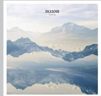
MAZONI. Ludwig . Bankrobber-Seed, 2021.