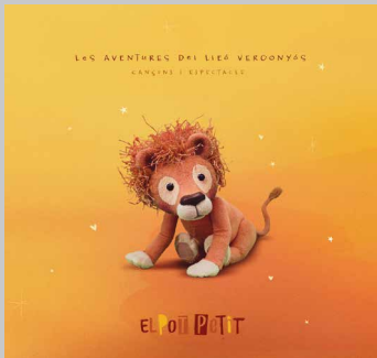
EL POT PETIT. Les aventures del lleó vergonyós . U98 Music, 2021.