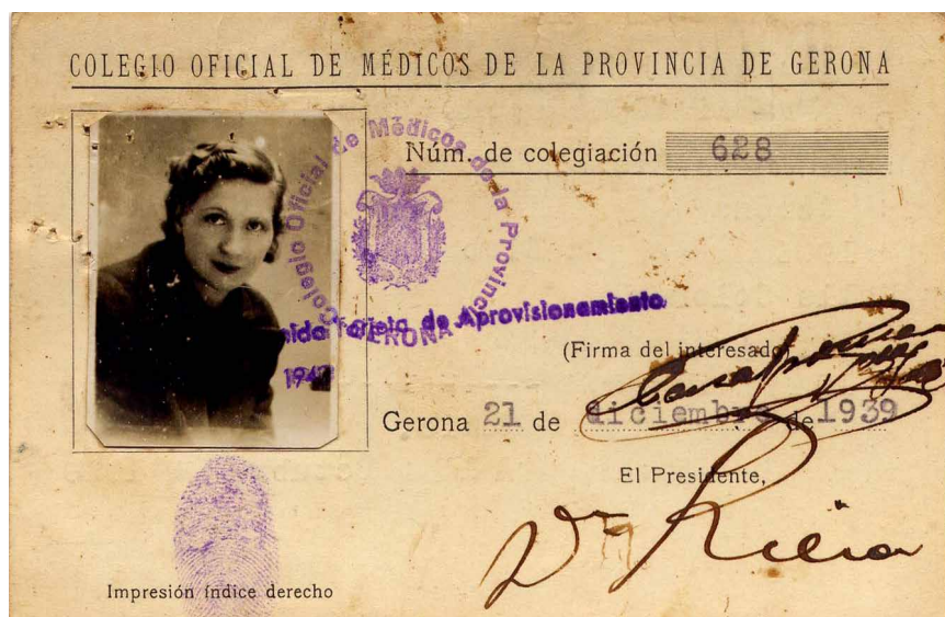
>> Carnet de col·legiada de la doctora Casaponsa. Any 1939.

Es va morir a la Bisbal l'any 1990. L'any 2006, amb motiu dels cent anys del seu naixement, el Col·legi de Metges de Girona, juntament amb l'Ajuntament de la Bisbal d'Empordà i amb el suport de la Generalitat i de la Diputació de Girona, va organitzar una exposició titulada «Dra. Casaponsa, gènere i figura». Des de l'any 2013, i a petició del Grup de Dones i de l'Ajuntament de la Bisbal d'Empordà, el Centre d'Atenció Primària (CAP) de la població en du el nom: la professionalitat, l'amabilitat i la dedicació de tota una vida van ser finalment recompensades.