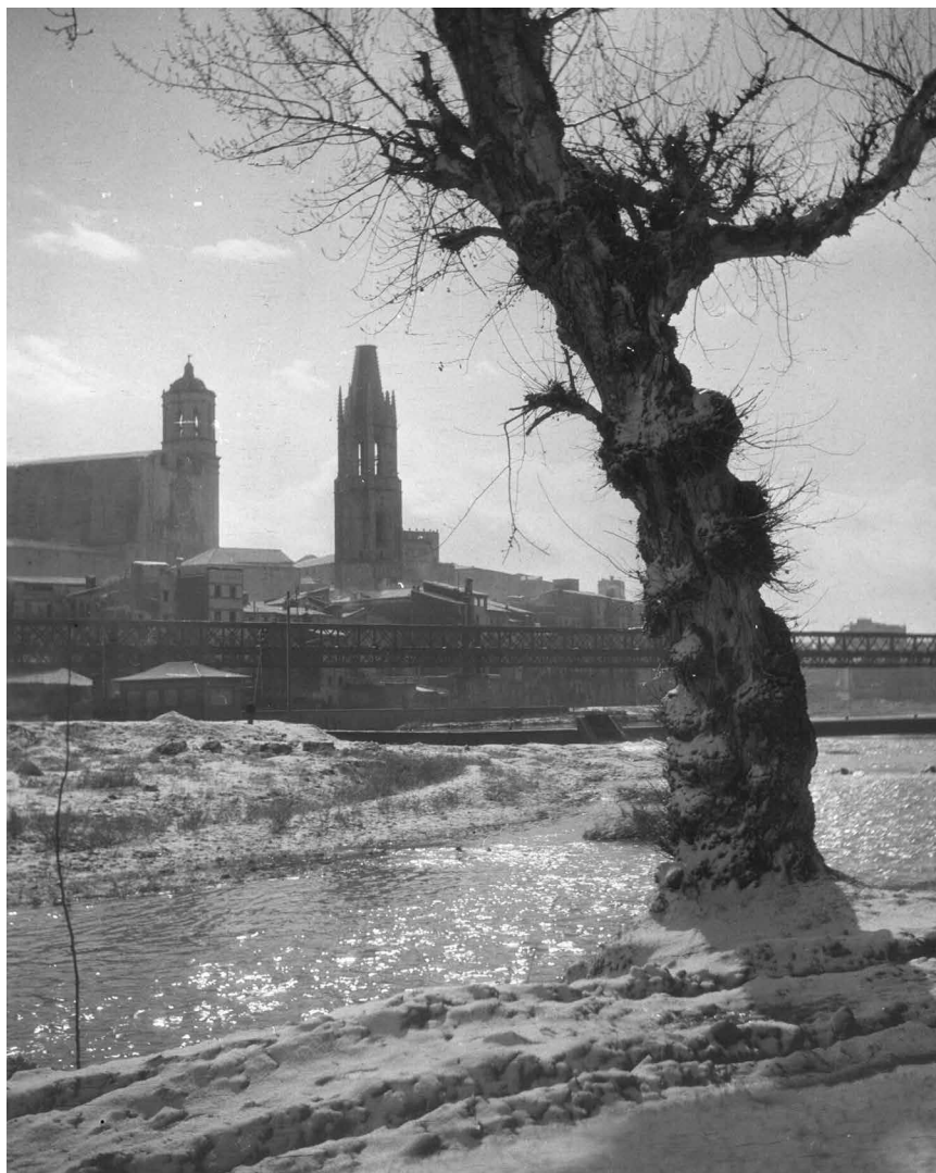
>> El llarg hivern gironí de la postguerra, 1945-1946.

El carrer dels Abeuradors fa avinent una ciutat, que jo he conegut, transitada per bestiar de peu rodó que, amb els carros, la proveïa de tot, i que, òbviament, necessitava abeurar-se