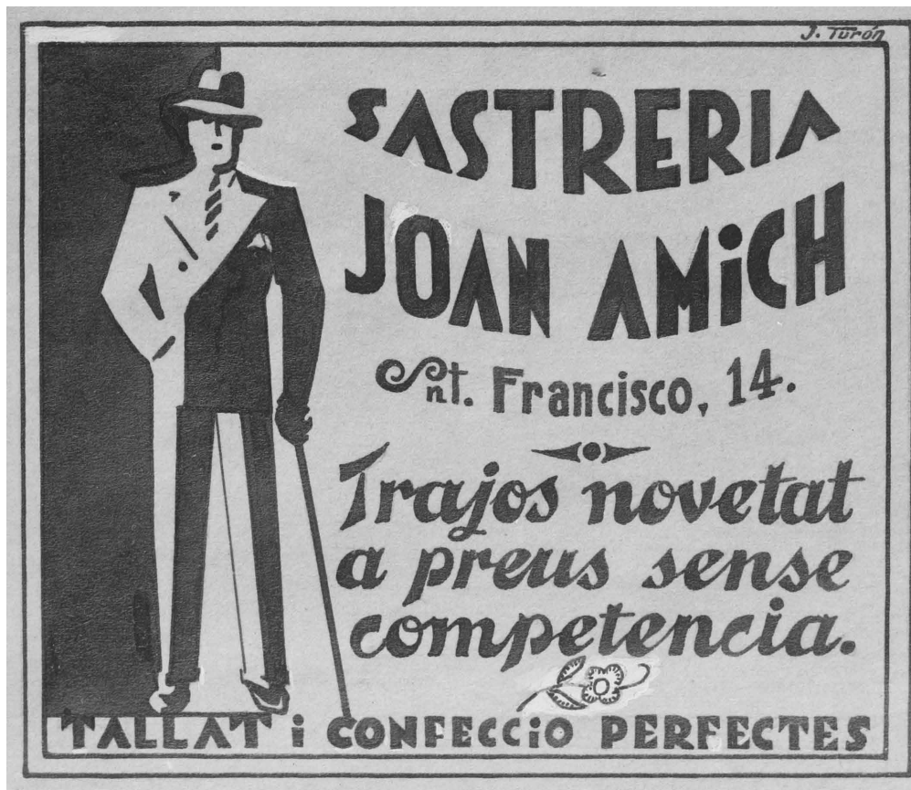
>> Cartell publicitari d'una sastreria de Girona, 1931.

El camàlic o bastaix era una persona que es llogava per portar coses de pes d'un lloc a l'altre. Davant de l'estació de la Renfe n'hi havia uns quants, amb uns carretons de la mida dels tirats per pollins i haques. Alguns anaven per lliure; d'altres, més ben vestits i uniformats, eren empleats d'hotels, que esperaven que els clients baixessin del tren per portar-los les maletes.