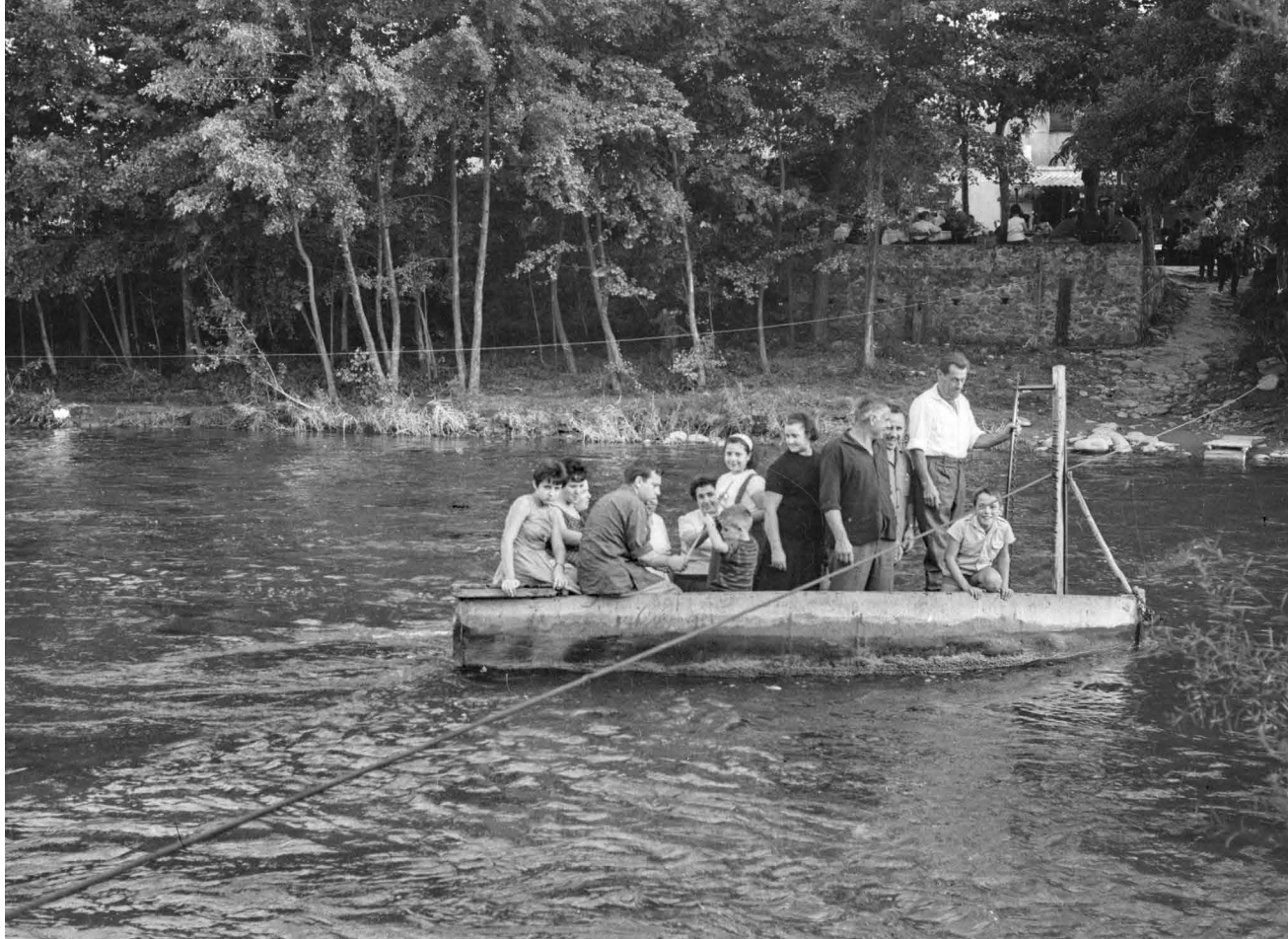
>> Barca de llibant de Bescanó, 1960-1970.

A més del tren de la Renfe, amb estació a la plaça del Poeta Marquina, n'hi havia d'altres de via estreta: el d'Olot i el de Sant Feliu de Guíxols, amb estacions veïnes d'aquella; i el de Palamós i Banyoles, amb estació compartida a Pedret.