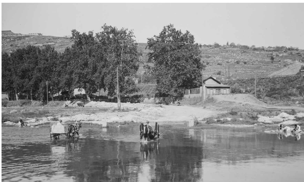
>> Dos carros travessant l'Onyar pel passallís (avui pont) de Pedret, amb l'estació homònima a l'altra banda i tres dones fent-hi la bugada, 1910-1930.