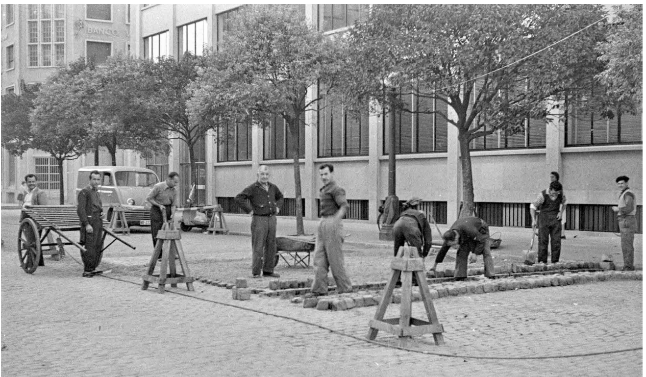
>> Operaris col·locant llambordes a la Gran Via de Jaume I, 1960-1970.

d'aquells altres que durant segles bastiren la Seu i tants edificis admirables que dignifiquen la nostra ciutat. D'adolescent, amb un meu amic, anàvem a fer pràctiques elementals d'escalada i ràpel en aquelles parets