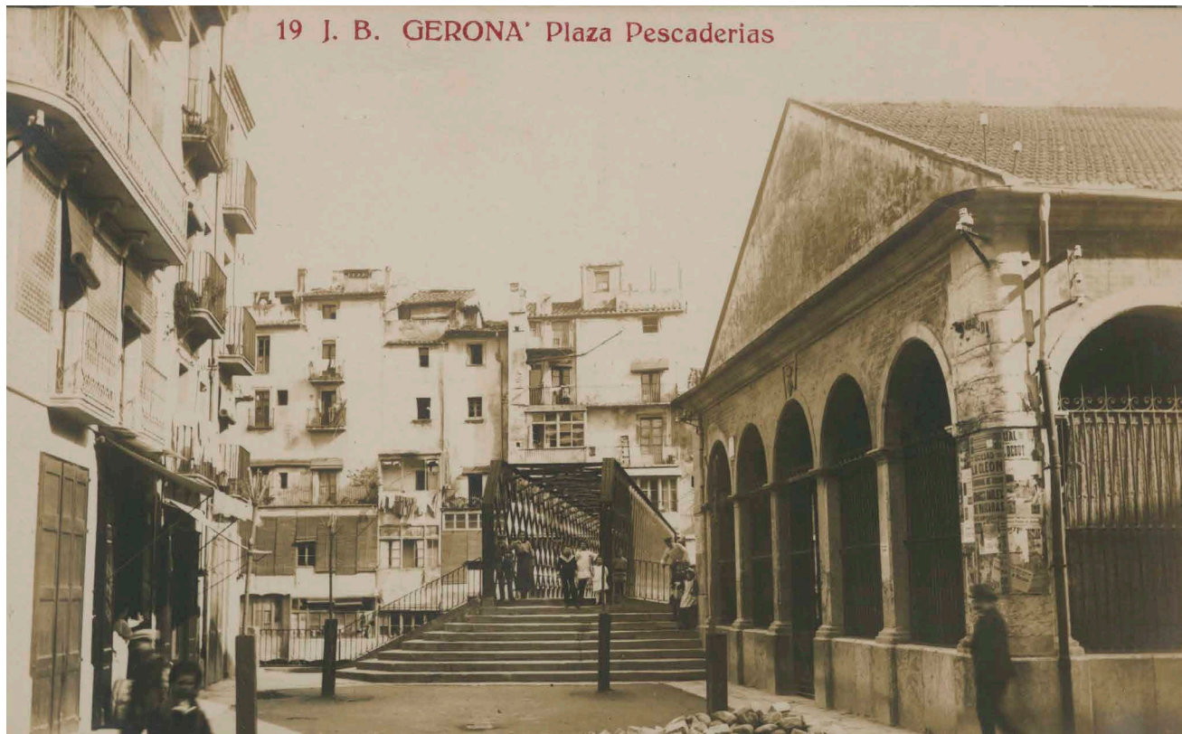
>> L'edifici de les Peixateries Velles i el pont homònim vistos des del carrer de Santa Clara, 1916.