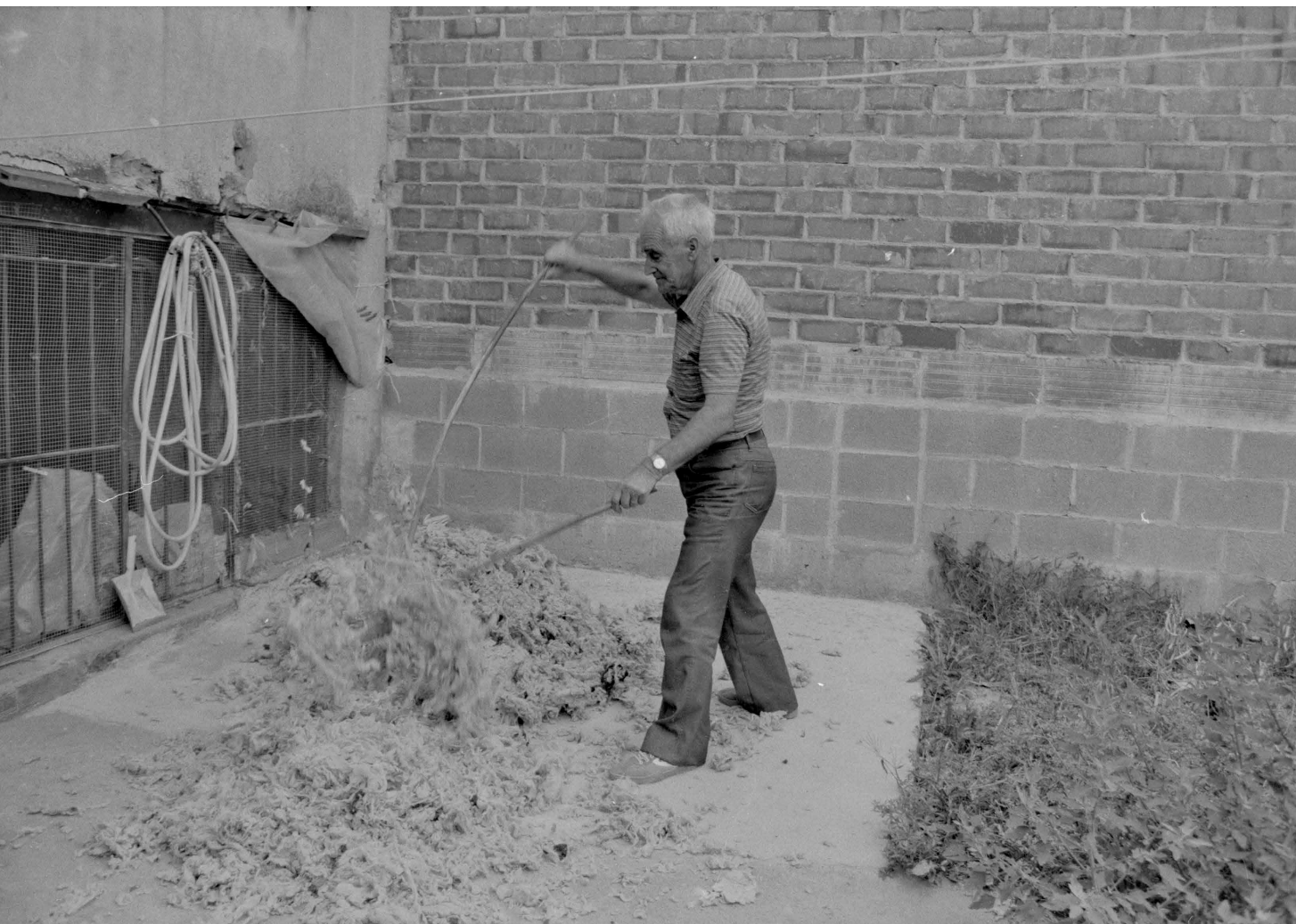
>> Matalasser arranjant un matalàs en un pati, 1989.

llana que hi havia quedat atapeïda, la distribuïa i la pitjava dins la funda, i tornava a cosir-ne el contorn i a fer-hi bastes, uns punts a una certa distància l'un de l'altre, perquè la llana no s'hi apilotés. L'espectacle, però, tant per a la vista com per a l'oïda, era l'esborrifament de la llana, tot vergassant-la, que es feia al carrer, en un tros de vorera o en un terrat prèviament escombrats. Durant una estona llarga, el munt de llana anava rebent fortes bastonades que fendien clarament l'aire. Aquesta verga llarga de freixe, corbada cap amunt, el vergançó, la feien anar amb una mà, mentre que l'altra sostenia una vareta, també prima però molt més curta, la verge-lla, amb la qual li donaven dos copets després de cada vergassada, per deslliurar-la de la llana que en penjava. Slum-clac-clac, slum-clac-clac... Per aquest rítmic i diferenciat repicament s'endevinava la proximitat d'un mata-