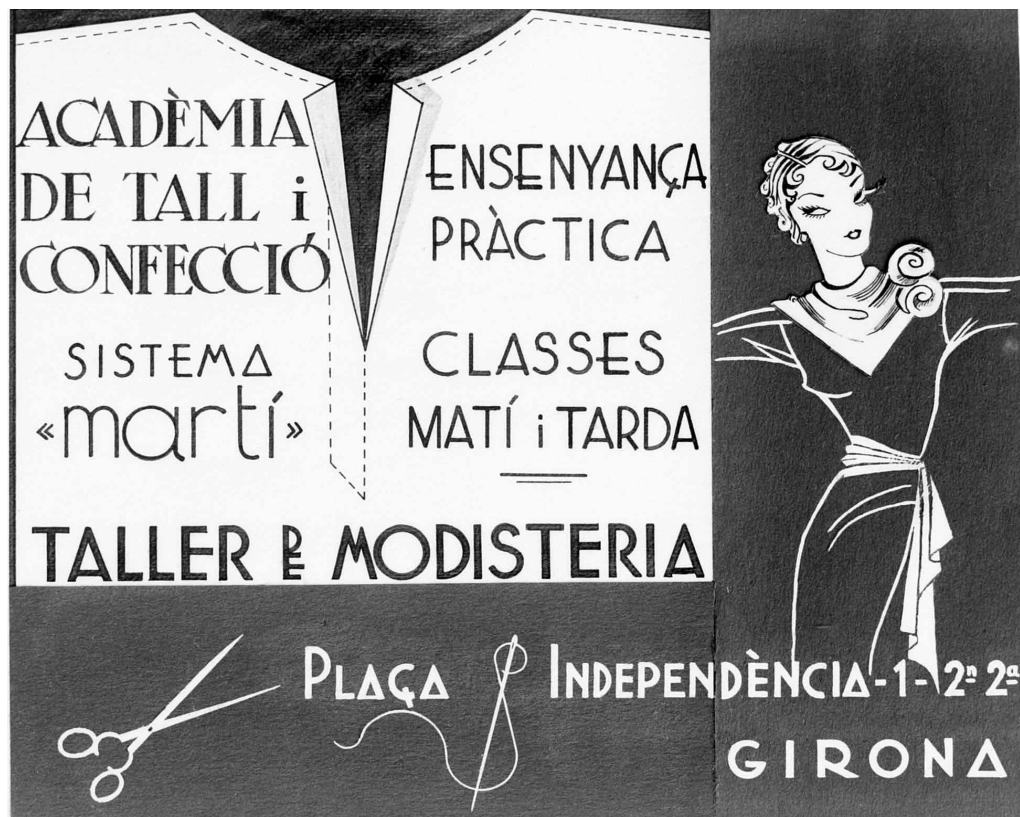
>> Cartell publicitari d'una acadèmia de modisteria, 1935.