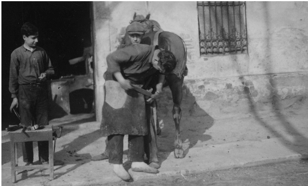
>> Ferrant un cavall, 1930-1940.