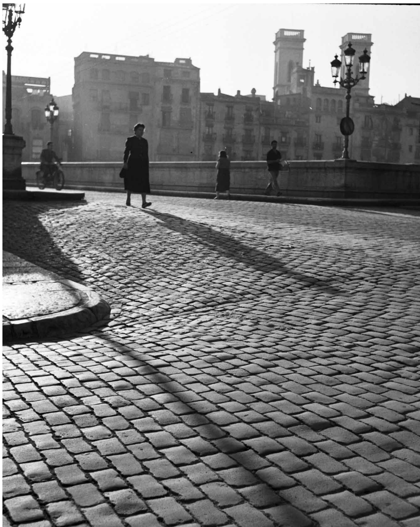
>> Pont de Pedra des del carrer de Santa Clara, 1960.

Peixateries Velles, de les Hortes, dels Rajolers, del Comerç; la travessia dels Canaders; el passatge dels Picapedrers; la pujada i els jardins de les Pedres; el carrer i la plaça dels Mercaders... Així mateix, algunes vies porten el nom de les mercaderies que s'hi elaboraven, s'hi venien, s'hi guardaven o dels mercats que s'hi feien: les places del Molí, de l'Oli, del Vi, del Pallol, del Gra o de les Castanyes; el carrer de les Olles, el de la Neu... Per la seva part, el carrer dels Abeuradors fa avinent una ciutat, que jo he conegut, transitada per bestiar de peu rodó que,