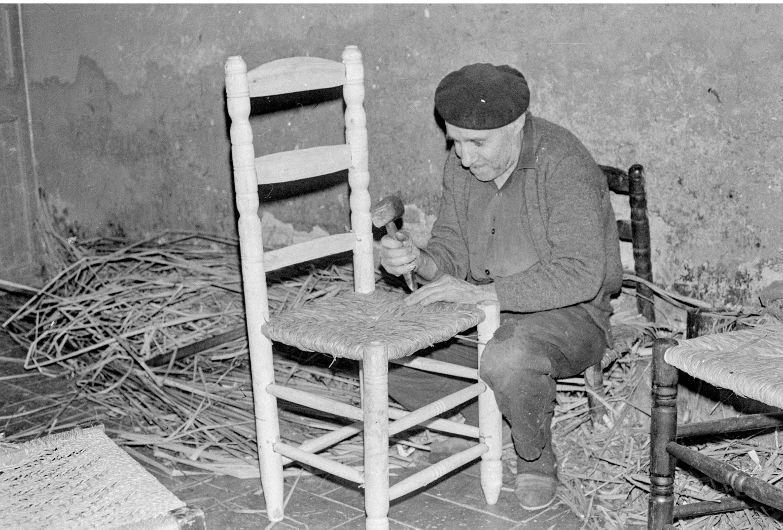
>> Embalcant cadires, 1971.

Els botellers feien bots i botelles de pell, generalment de boc, que, una vegada cosits i empegats, servien per