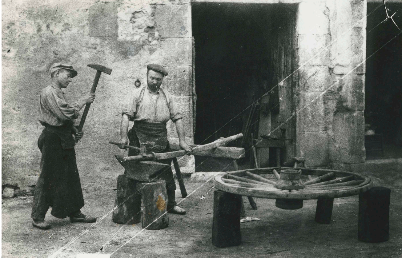
>> Carreters reparant la roda d'un carro davant del taller, 1910-1930.

(que ja n'estava alliberada), va fer trabucar el vehicle, que, com que era més pesant que la bèstia, el deixà suspès enlaire, penjant dels llargs braços del carro i pernejant debades, sense tocar a terra, per atènyer el cobejat objectiu, bo i exhibint ostensiblement i impúdicament un enorme penis negre en erecció.