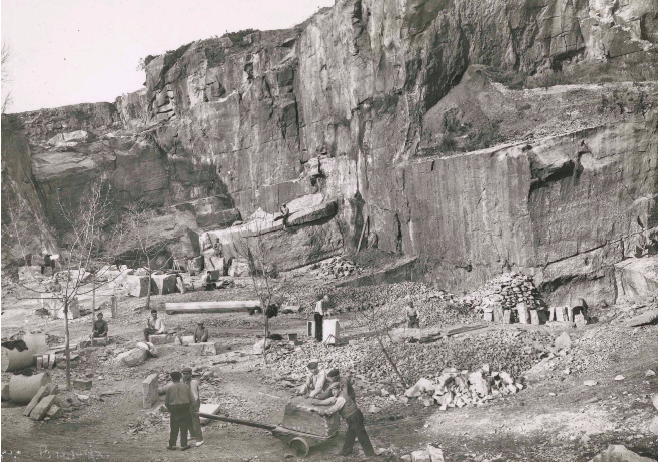
>> Picapedrers treballant en una pedrera, 1920-1930. En primer terme, un carro de llança per al transport de blocs.