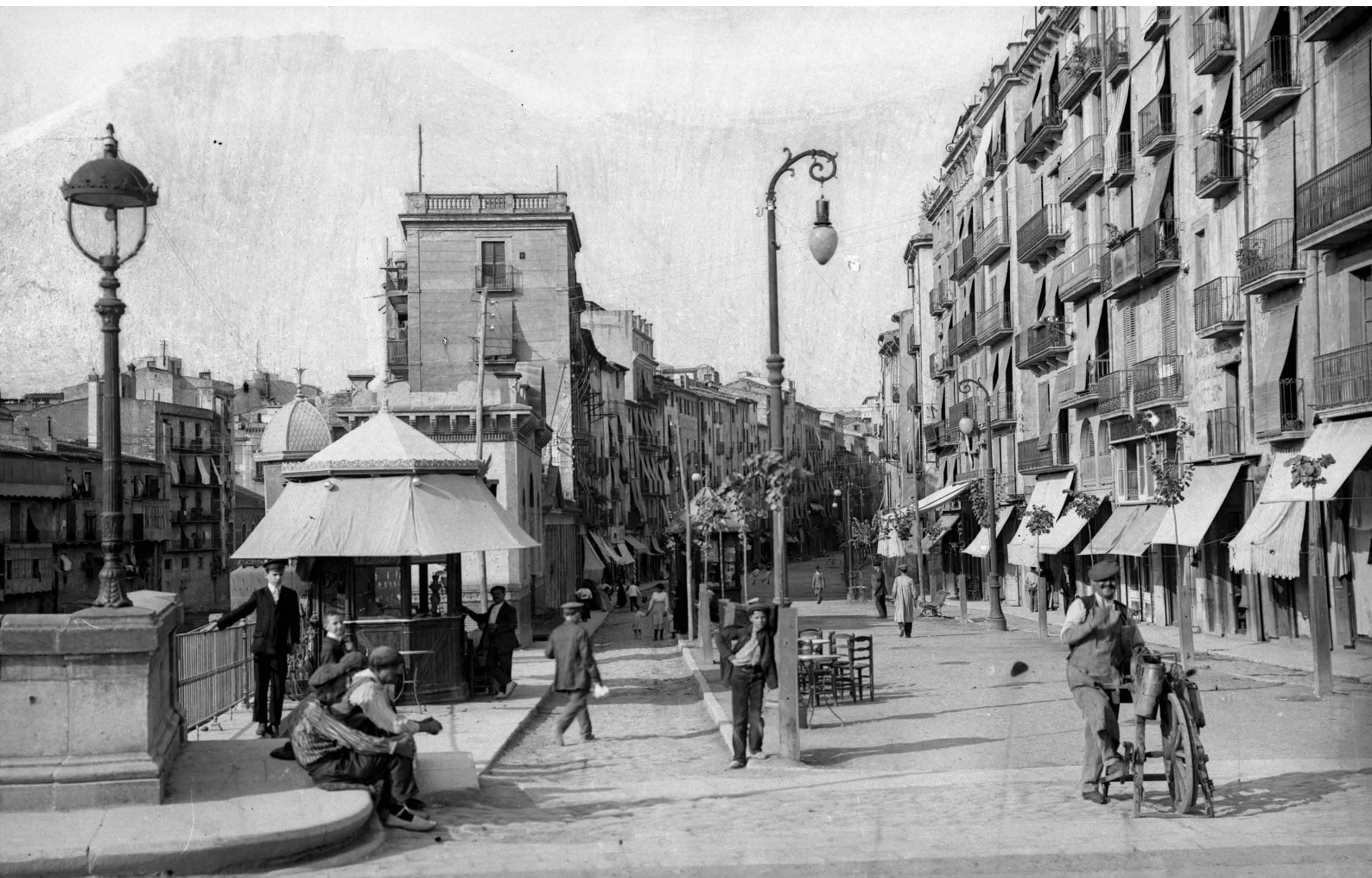
>> Esmolet al començament de la rambla de la Llibertat, 1910-1912.

Raons d'espai em priven de continuar, i això que m'agradaria parlar d'altres funcions curioses, esguardades des del present. Dels ordinaris, la majoria sense mitjà de locomoció propi, que anaven i venien regularment d'un lloc a l'altre en transport públic i feien els encàrrecs, les compres i els lliuraments que els encomanaven, sempre amb el mocador de fer farcells (on duïen els paquets) penjat a l'esquena. Dels enllustradors ambulants, amb llur caixeta de fusta d'ampla nansa al mig i tapa a banda i banda, d'on treïen betums, llustres, tints, raspalls, draps i camusses. Dels burots, uns modestos funcionaris municipals encarregats de cobrar els drets d'entrada de certs productes, que em recorden l'antic privilegi gironí (xv-xix) de la mitja lleuga (la prohibició de vendre certs articles a menys de mitja llegua de les muralles per evitar els impostos que pagaven els comerciants de la ciutat). Del reconstruït de la serp, un venedor d'ungüents