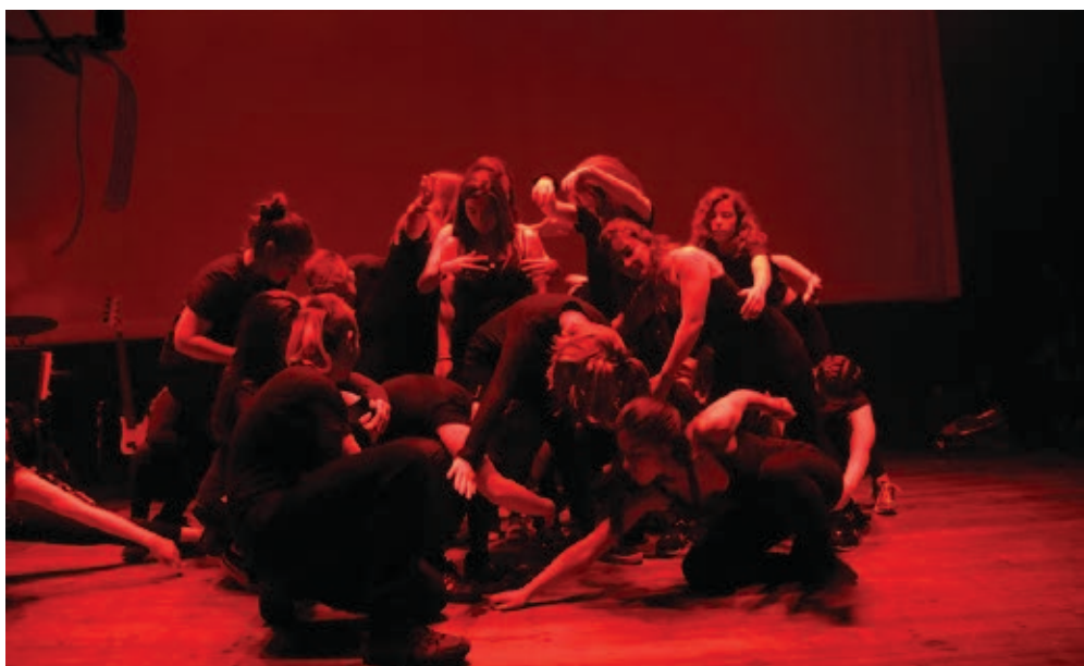
>> Actuació a l'Auditori de l'Ateneu de Banyoles dels alumnes de l'Institut Josep Brugulat.