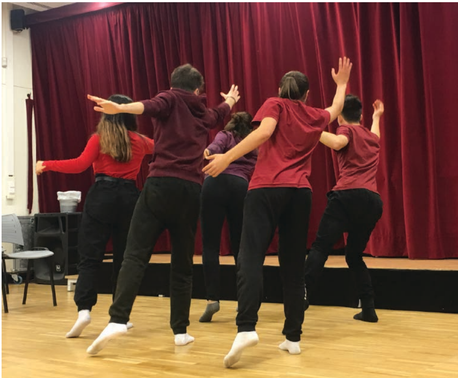
>> Taller d'improvisació dels alumnes d'arts escèniques de l'Institut Santiago Sobrequés de Girona.