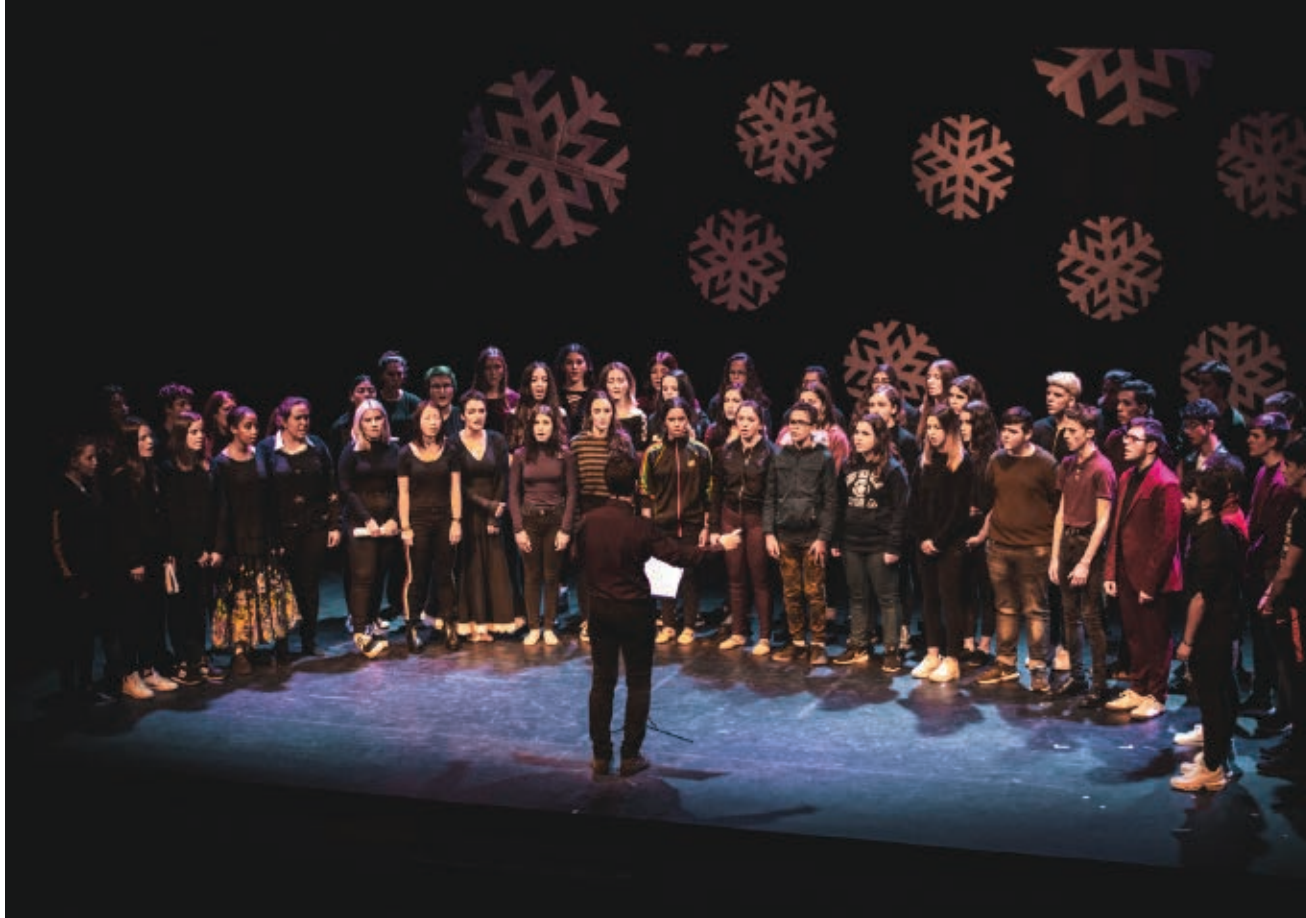
>> Concert de Nadal dels alumnes de l'Institut Alexandre Deulofeu de Figueres, el desembre del 2018.