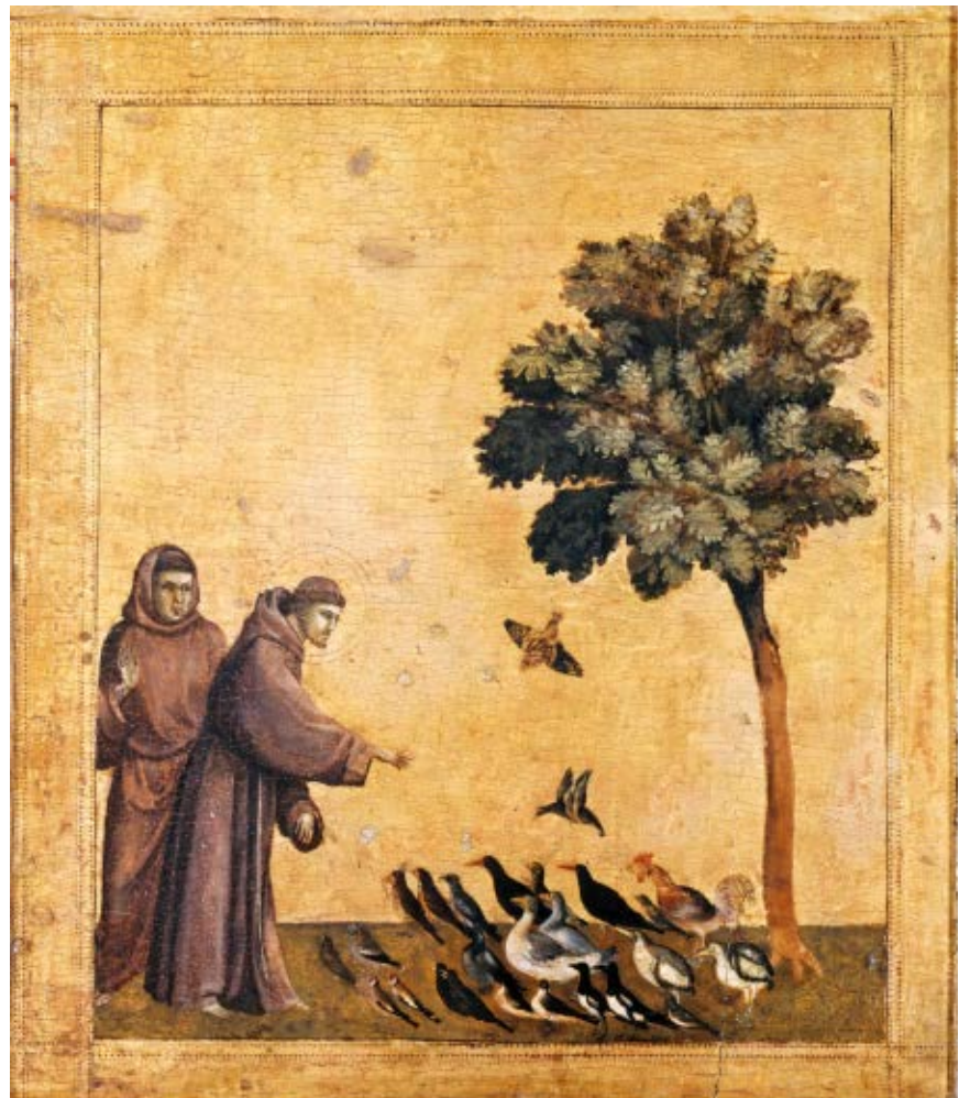
>> Francesc d'Assís alimentant els ocells, de Giotto.

Al Llibre dels àngels , Eiximenis es refereix a un clergue que, en comptes de seguir «la doctrina i les petjades de Nostre Senyor Jesucrist», actuava com el franciscà panxut i mandrós de la tradició literària medieval. Aquest clergue destinava els «béns del patrimoni de Jesucrist» a tenir «grassa taula», és a dir, a menjar i beure bé, en comptes de fer-los servir per ajudar els pobres i les causes pies. Amb els seus textos, Eiximenis no només va denunciar, com a moralista, aquestes males pràctiques, sinó que, com a conseller polític, va donar eines per ajudar els qui, com va dir en el Llibre de les dones , «sofreixen una pobresa i una misèria terribles amagadament en llurs cases».