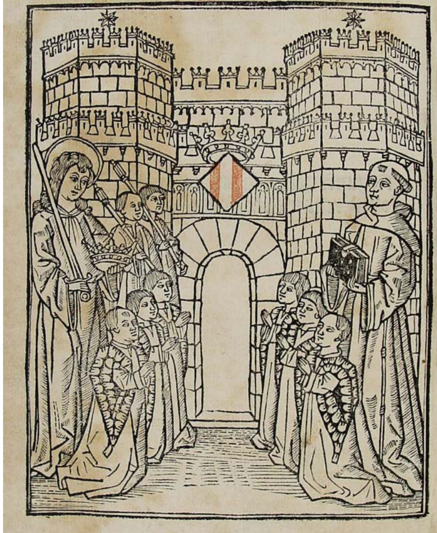
>> Eiximenis lliurant el Regiment de la cosa pública als jurats de l'Ajuntament de València.

«a temps cert», és a dir, en un període determinat de temps.