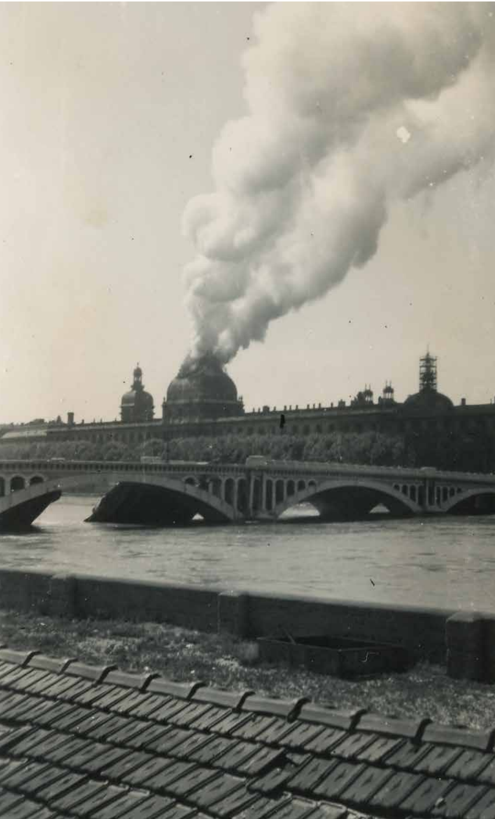
>> Sense títol [Lió durant la retirada alemanya], 1944. Paper al gelatinobromur de plata (fotografia d'àlbum), 6,5 × 10,5 cm.