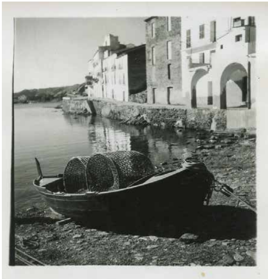
>> Sense títol [ Cadaqués, Port Alguer ], 1932-1936. Paper al gelatinobromur de plata (contacte de negatiu), 9,5 x 6,5 cm.