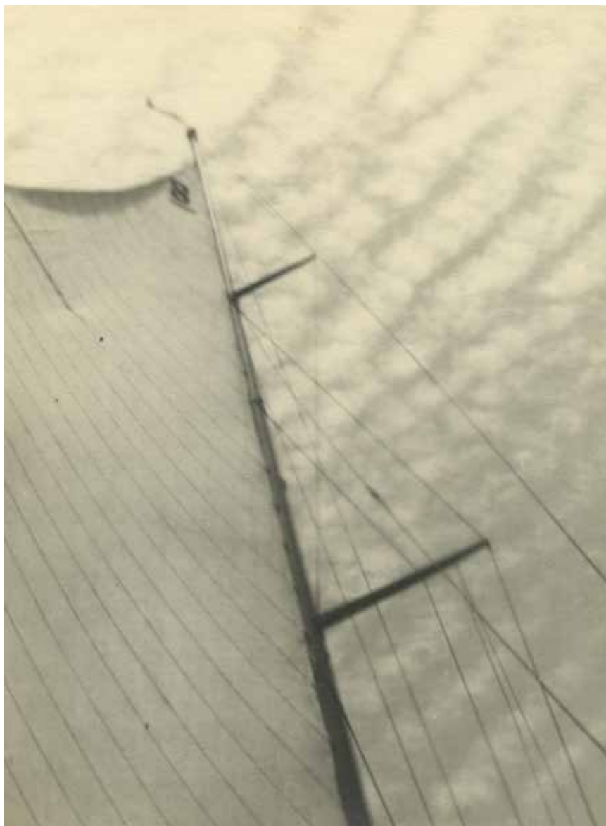
>> Alai, 1934. Paper al gelatinobromur de plata, 22,5 × 16,5 cm.