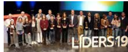
>> Els guardonats en la darrera edició dels premis Ripollès Líders.

I, per acabar, dues referències breus als dies de gresca del Carnestoltes, que ja han passat i que a la comarca les poblacions celebren de manera esglaonada, segons un calendari pactat entre els diferents ajuntaments, a fi de no encavalcar-se. El més matiner va ser el de la població de Campdevàrol, seguit del de Ribes de Freser. Aquest darrer és, a parer meu, el més irreverent i teatral, amb escreix, de tots els que es fan al Ripollès en els dies previs a les estretors de la vella Quaresma... Només cal dir que es fa sota l'advocació de santa Truja, que dura una setmana i que el darrer dissabte del mes és el dia principal de les carnestoltades, ja que està dedicat a aquesta santa.