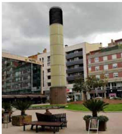
>> La torre d'enllumenat i d'extracció de fums («el cigarro») de la plaça de Miquel Santaló.

Venent fum | No creiem, en canvi, que el terrabastall perpetrat al carrer de la Creu —la consigna és eliminar cotxes com sigui— tingui els efectes desitjats. En aquestes latituds nostres, on és costum decidir i després planificar, és com a mínim arriscat aprovar que la plaça de Catalunya sigui per a vianants —com si ara no hi passés ningú—, per allò que, a les ciutats comme il faut , tots els barris vells han de ser zones lliures de vehicles. Passa, però, que Girona és un cas excepcional i el seu barri vell no és al centre, sinó que queda arrapat en un extrem de muntanya, i ja ens explicaran —als taxistes, sobretot— com es pujarà a les Pedreres. Els germans Roca, que han obert el seu local xocolater a tocar de la plaça, l'han batejat com