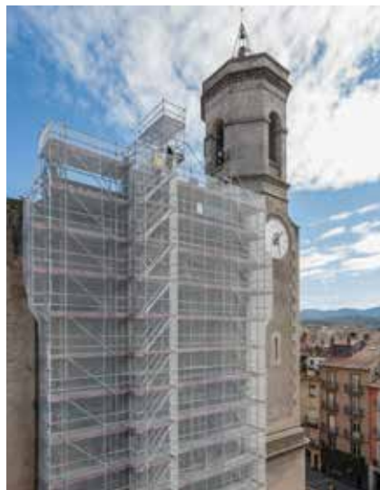
>> Façana principal de l'església de Sant Esteve d'Olot. (Autoria: QUIM ROCA)

| L'Ajuntament de Sant Jaume de Llierca considera que el Tribunal Superior de Justícia de Catalunya li dona la raó i que cal fer un nou estudi de neces-