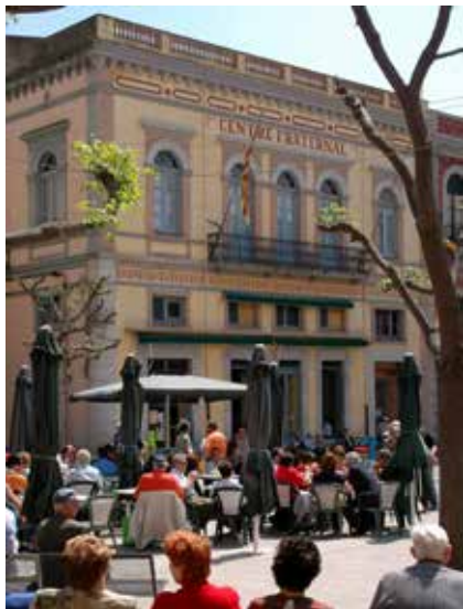
>> El Centre Fraternal de Palafrugell, a la plaça Nova.

del teatre, dedicada sobretot a balls, quines i altres activitats lúdiques. I tot plegat es fa mantenint l'essència històrica, l'esperit d'un poble i d'un local sense el qual la història de Palafrugell no seria la mateixa.