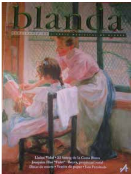
>> Portada del número 22 de la revista Blanda.