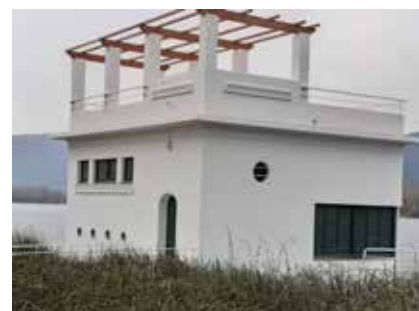
>> La pesquera de Banyoles, on s'han fet obres.

gués, fer un port per a creuers. Et penses que seria l'únic estany de creuers del món? Podríem recuperar i ampliar el Barbiland amb una muntanya russa que envoltés l'església de Porqueres i se submergís a l'estanyol de la Cendra; podríem recuperar l'estanyol del Vilar com a abocador d'aigües brutes, podríem transformar tot Banyoles en una vila neolítica i viure-hi com si fóssim neolítics. No, aquesta última idea, no: és massa real... M'agrada tant que m'incitin a ser creatiu sense límits racionals! Els ho podries dir, tu que hi coneixes gent, allà dins?» Mai el meu nebot havia desbarrat com avui.