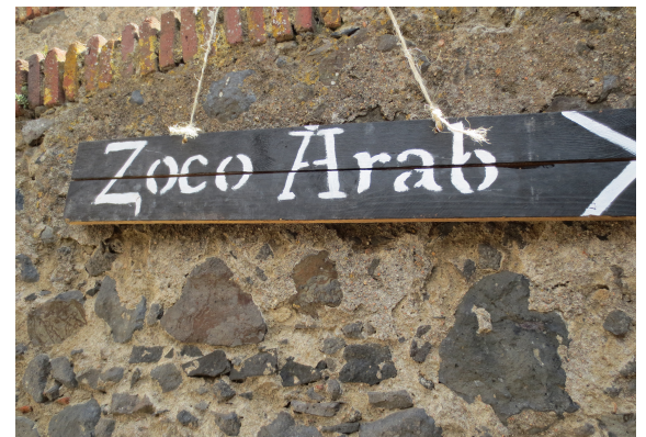
>> Cartell de la Fira Medieval d'Hostalric. En les manifestacions i mercats medievals hi ha una manipulació de la història.

nacional, religiosa, de gènere, de grup, de cultura, de la tria alimentària i del gust o el disgust. Com explica Norbert Elias ( The civilizing process ), les normes de taula són tant el medi com el mitjà a través del qual la població s'acostuma a la convivència, és a dir, que són un factor de civilització important, d'adequació al medi social. El concepte de comensalitat és com si l'acte fisiològic de menjar ens fes humans (igual que ens en fa la consciència del paisatge), com diu J. Cruz Cruz: «comer en compañía es el fenómeno por el que el hombre trasciende de hecho o realmente su animalidad: su necesidad biológica de comer no se satisface de manera puramente biológica». I encara afegeix: «la comida en la mesa festeja de suyo nuestro ser de hombres en común» ( Alimentación y cultura ). No és estrany que Faustino Cordón afirmi que «Comer hizo al hombre», en una suggestiva teoria del procés d'hominització, i que estudis més recents, com els d'Eudald