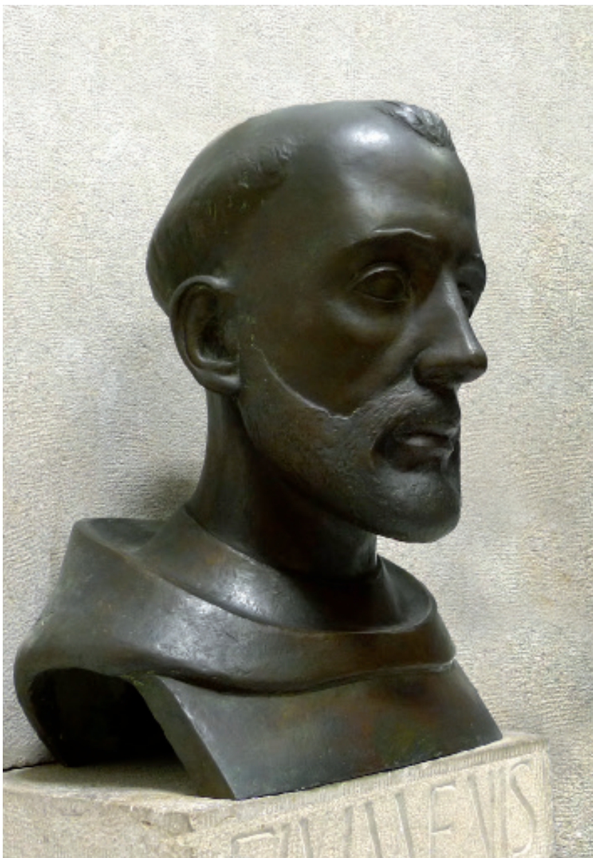
>> Bust d'Eiximenis (Autoria: PEP CABALLÉ)

que, no obstant això, en afectar el menjar, potser en el món acadèmic no ha estat valorada com cal. En la vida corrent, es confon amb unes normes d'urbanitat que a causa de l'empatx franquista-catòlic es consideren obsoletes. Passa una mica com amb l'ecologia, que quan l'estudiàvem era una part ínfima, a penes perceptible, de les ciències naturals, i que ha esdevingut un aspecte important tant del debat acadèmic com del ciutadà. Però, en tots els casos, les diverses cuines, a taula, s'expressen a través de normes que expliquen força coses de la manera de ser d'una col·lectivitat: a taula no es comportaven igual (o sí) els medievals que nosaltres, i no ho fan de la mateixa manera els àrabs, els nord-americans o els xinesos. La comensalitat (o convivialitat , com es diu a França) i les seves normes són un reflex visual preciós de les relacions personals: la classe i la jerarquia social i els rols socials, la convivència, l'amor i l'amistat, la identitat o identificació