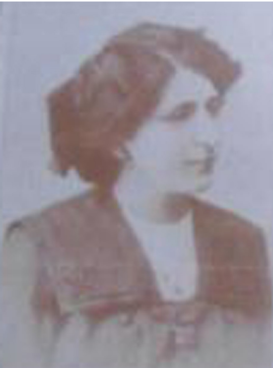
>> Imatge extreta del programa del concert del 10 de febrer del 1910 al Teatre Principal de Barcelona.