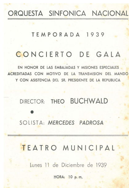
>> Programa d'un concert ofert el desembre del 1939 a San Juan de Puerto Rico.