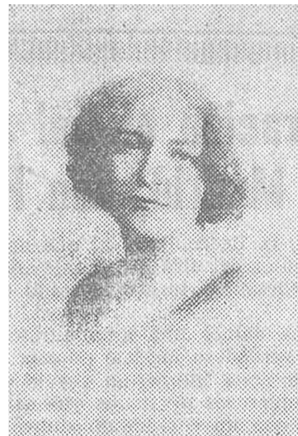
>> L'artista gironina, el 1936.