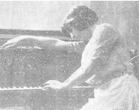
>> La pianista, l'any 1917.