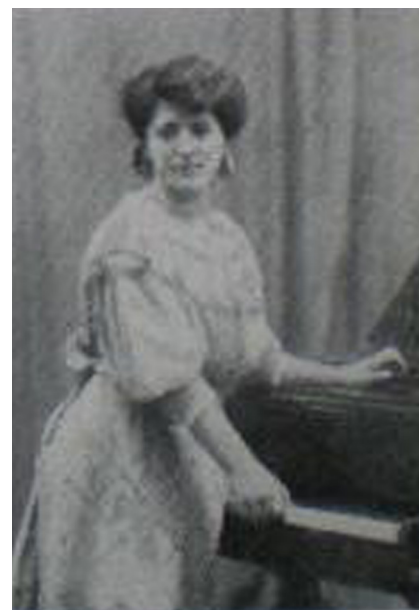
>> La pianista, cap al 1910. (Font: NUEVO MUNDO)

Conservatori li va concedir post mortem la seva màxima distinció. Va morir a la seva residència de Miraflores el 26 de juliol de 1972, a l'edat de 80 anys. Serveixin aquestes línies d'homenatge i record a aquesta il·lustre gironina.