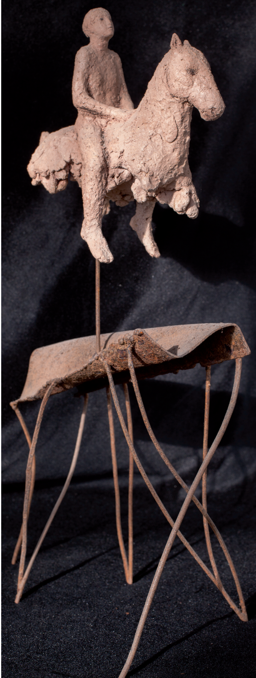
>> Pont entre el passat i el demà, 2010. 48 x 25 x 15 cm. Ferro i terra cuita.

Sempre ha dibuixat molt. Amb el dibuix aconsegueix «atrapar moments de vivències», reproduint paraules