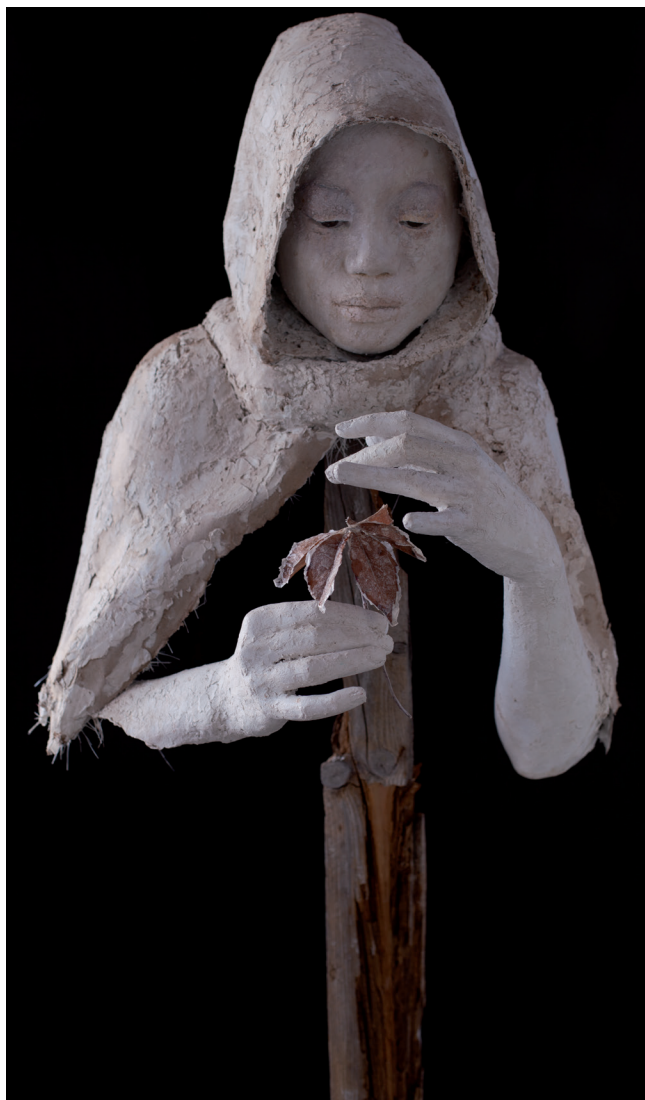
>> Observant la fragilitat de la natura, 2018. 70 × 45 × 42 cm. Massilla, fusta i paper.