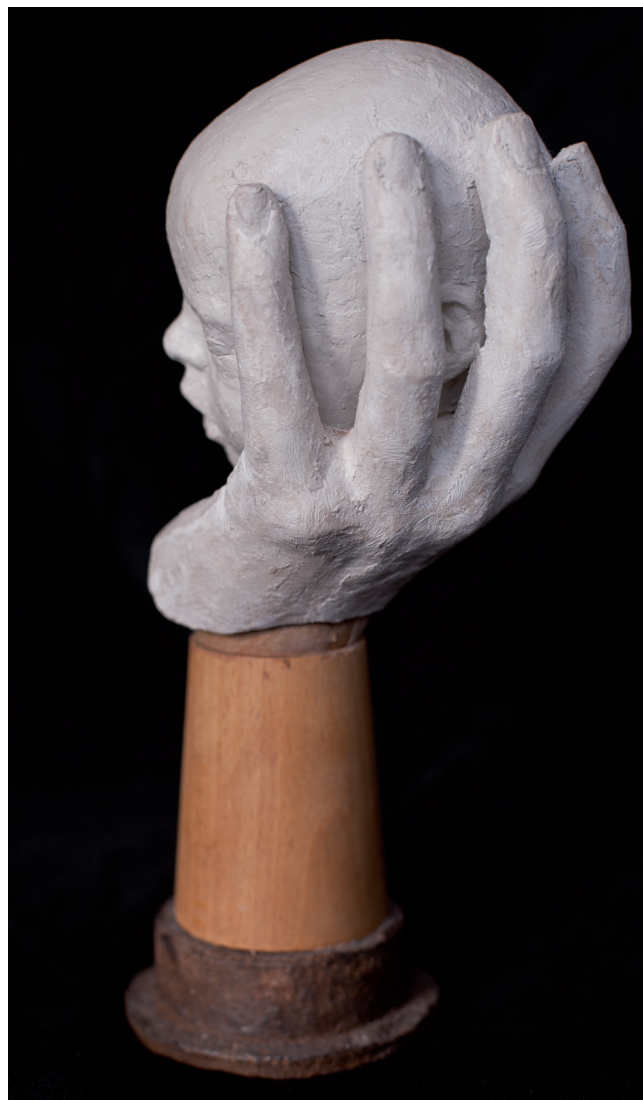
>> Esperant el retorn d'una mirada, 2016. 27 × 12 × 12 cm. Massilla, fusta i ferro.

seves. Tot seguit aquestes sensacions viscudes i plasmades sobre el paper sovint les traspassa al fang, on queda gravat i guardat el que l'ha inspirat i l'emociona.