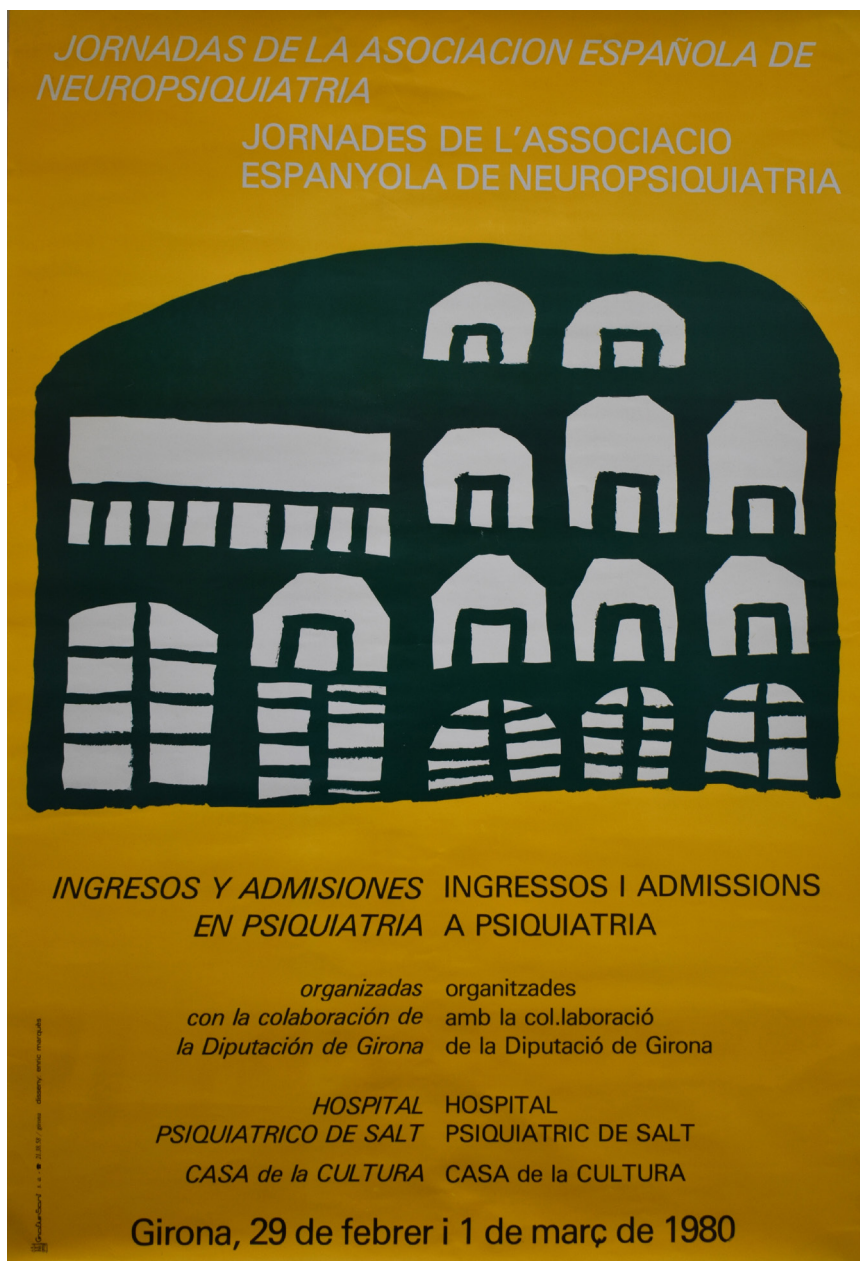
>> Cartell de les I Jornades de l'Associació Espanyola de Neuropsiquiatria, del 1980.

«Aquest cap de setmana tindran lloc a Girona i Salt les I Jornades de Neuropsiquiatria que organitza l'Associació Espanyola de Neuropsiquiatria en col·laboració amb la Diputació de Girona [...]. Crec que l'ocasió és important. Les Jornades coincideixen, en el temps i en les estructures, amb el naixement d'una nova consciència