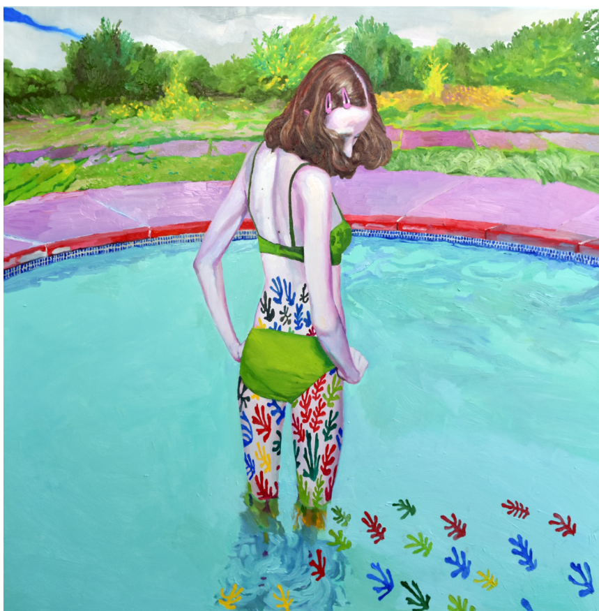
>> Piscina, 100 x 100 cm.

perfecta, abassegadora, però sempre que la contempli o la contemplem ens haurem d'esforçar a cercar-hi un inici i un final, i part del trajecte intermedi. Quin joc tan ben proposat! Quin ham tan ben llançat! Quantes històries en un únic fotograma!