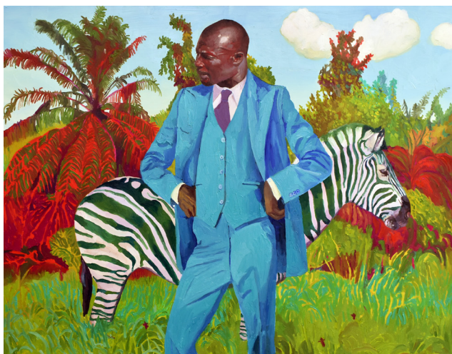
>> Dandy, 100 x 100 cm.