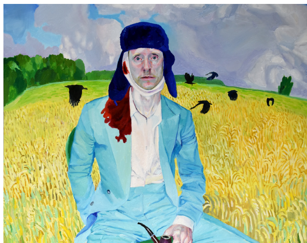
>> Dandy Gogh, 100 x 100 cm.