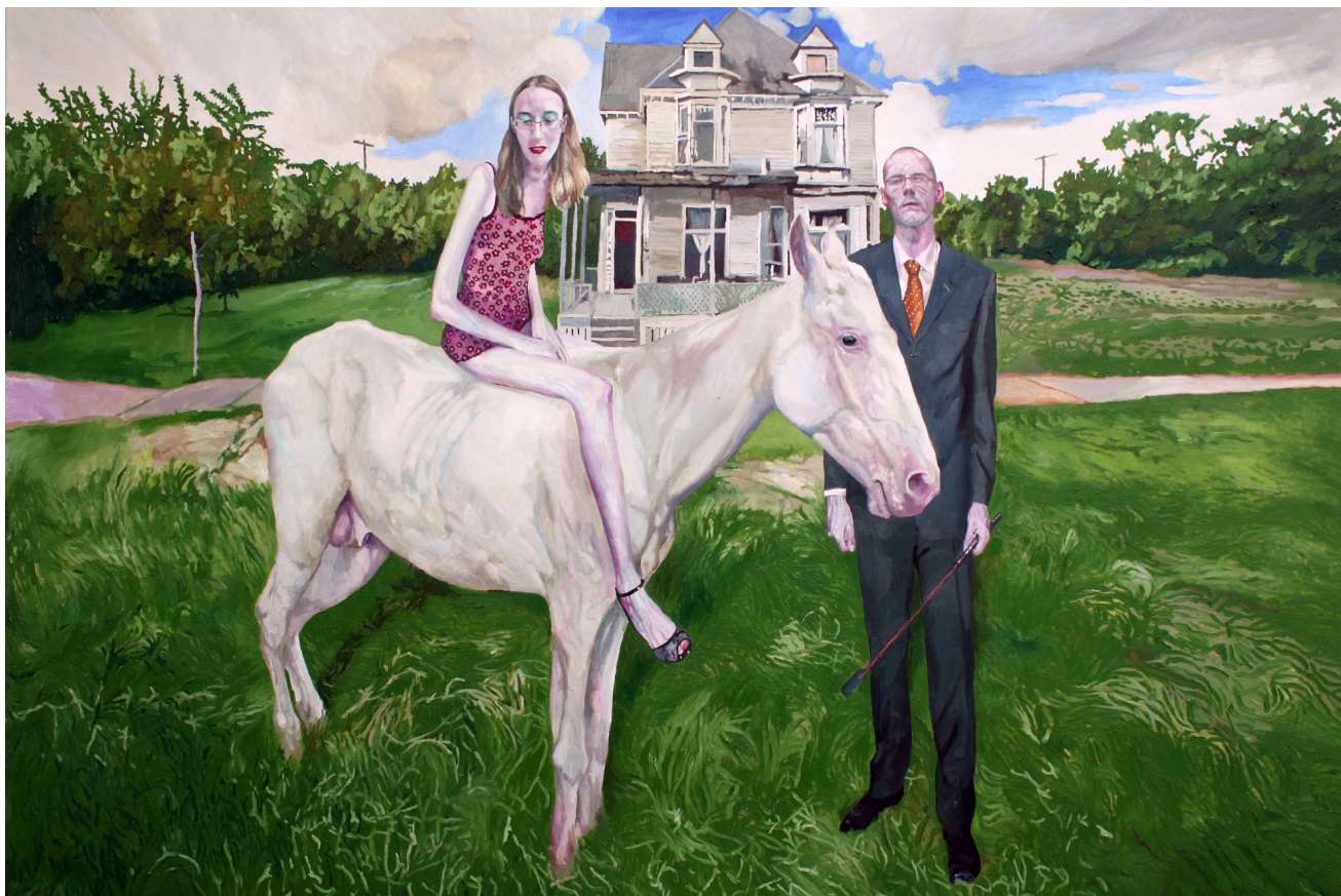
>> The lesson, 130 x 195 cm.