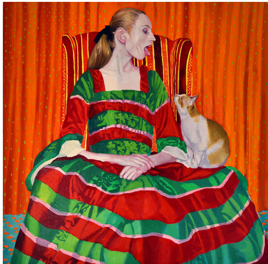
>> Princesa, 100 x 100 cm.

tes «decoratius», que, com Van Gogh, equilibraven d'una altra manera els colors, amb llenguatge propi i agosarat, i els artistes que des de la narració produeixen superbes narracions, com Lucian Freud, Balthus o David Hockney. I en aquests models gegants s'enquibeixen les dèries narratives de Xevi Solà, imaginades escenes derivades dels còmics que posava a l'abast Josep Toutain, tot, però, passat pel sedàs reflexiu, introspectiu, d'avui dia.