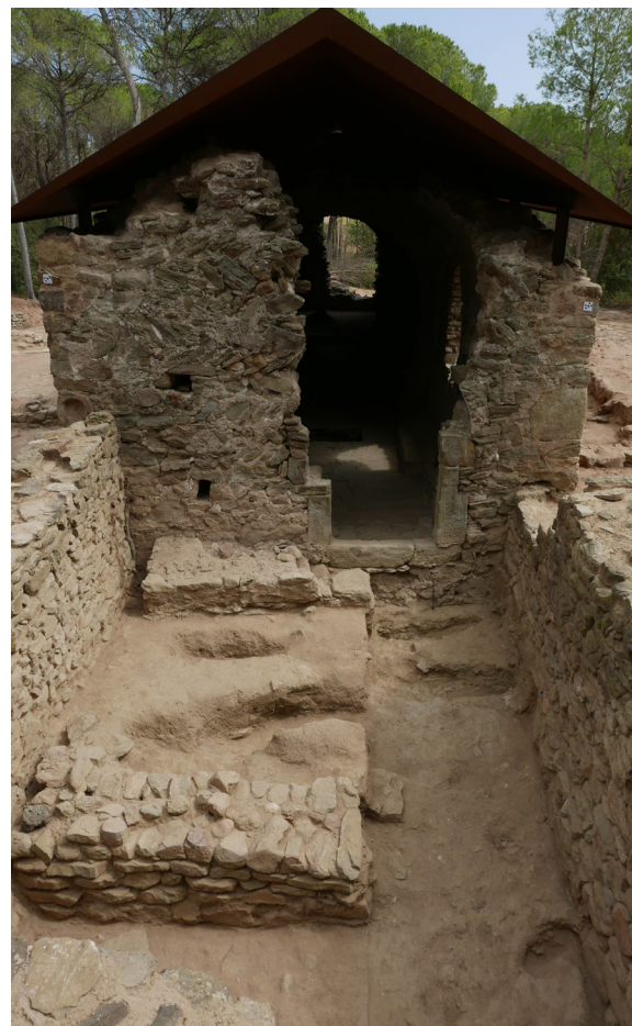
>> Façana oest de l'església de Sidillà després de les intervencions de 2015 i 2016, amb el banc per a la cura dels morts contra la façana, les diferents tombes i els murs de l'estructura protegint l'accés oest.

Les intervencions arqueològiques confirmen l'edificació de l'església en un indret amb presència d'elements precedents, com és una tomba monumental just a tocar de la façana nord de l'església, amb una cronologia dels segles IV al VI. La construcció de l'edifici religiós, tal com el veiem avui dia, trenca aquesta tomba monumental i es dota d'un paviment de morter corregut