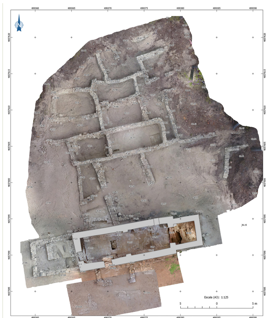
>> Ortofotografia del poblat, l'església, la façana oest i la façana sud de Sidillà.

L'església delimita el sud del conjunt, el poblat s'estén al nord de l'edifici eclesiàstic i l'extrem septentrional està atermenat per un edifici, dit de Sant Sebastià, i que ara sabem que a inicis de l'antiguitat tardana va tenir ús funerari com a mausoleu.