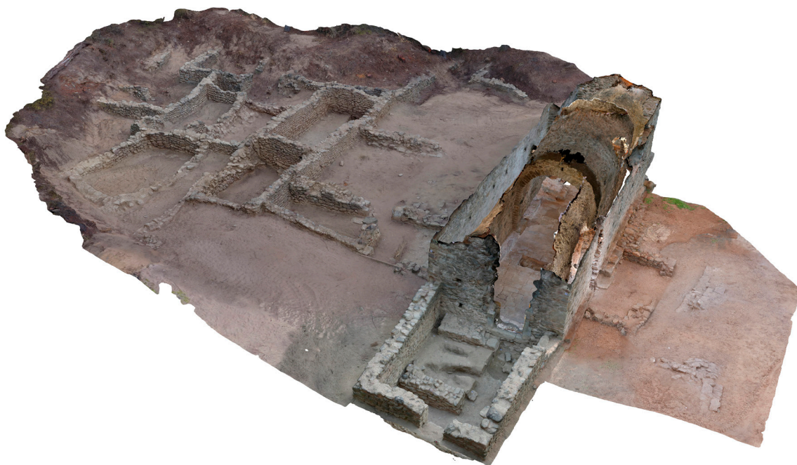
>> Modelització 3D de Sidillà: sector de l'església, estructura adossada a la façana oest i aglomeració d'espais d'ús domèstic.

que ha estat descobert tant a la nau com a l'absis. Just sota el lloc on hi havia la taula d'altar es va trobar (construïda en pedra tova de traverti) la caixa de relíquies buida. Quan la població es traslladà a Sant Llorenç de les Arenes, a finals del segle XI, és possible que també hi portessin les relíquies. Aquesta església d'inicis del segle X funcionà amb dues portes, l'una al nord i l'altra al sud. Poc temps després es produí una remodelació arquitectònica i litúrgica a l'interior: nova pavimentació amb grans lloses de gres, construcció d'un banc continu al voltant de la nau per als fidels, sobreelevació de l'absis, ampliació de l'espai litúrgic del santuari (l'anteabsis per al clergat) delimitant-lo amb una estructura transversal, tancament de la porta nord i remodelació de la porta sud. Els canvis coincideixen amb la reorganització i implantació de la xarxa parroquial.