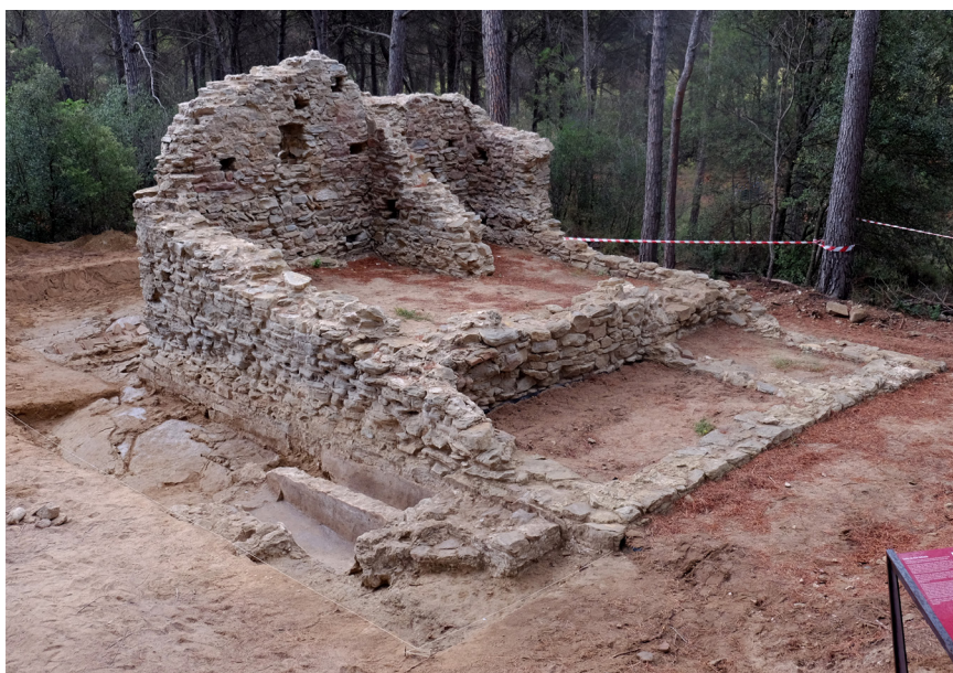
>> Edifici funerari al nord del puig Margodell en finalitzar la intervenció arqueològica de setembre de 2017.