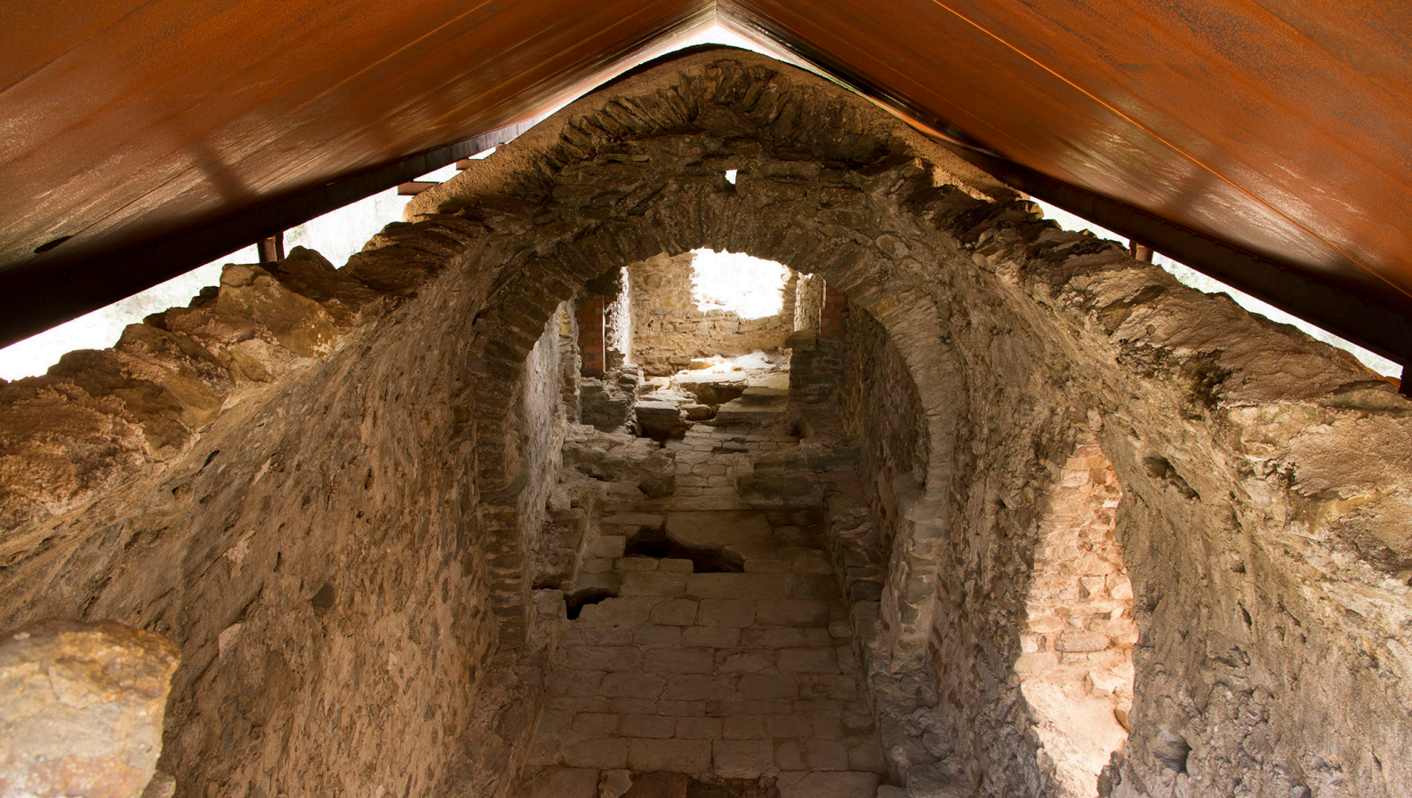
>> Església de Sant Romà de Sidillà. Interior de l'edifici en el procés d'excavació de 2015. Fotografia presa d'oest a est.

Diferents elements permeten confirmar l'existència, almenys ja als segles II i III dC, d'una vil·la romana que s'estén per tot el turó, especialment al sector sud. Els diversos canvis de la meandrificació del riu Ter provocaren la formació d'importants sediments sorrenços que començaren a cobrir el poblat i obligaren els habitants de Sidillà (en la seva fallida lluita contra la duna) a traslladar-se al veïnat de Sant Llorenç de les Arenes a finals del segle XI.