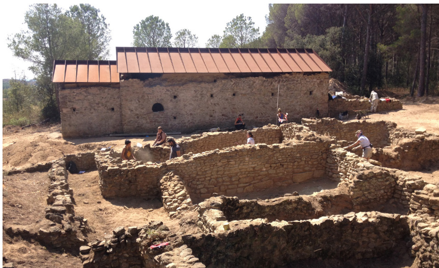
>> Treballs d'excavació al sector del poblat de Sidillà durant la intervenció de 2016.