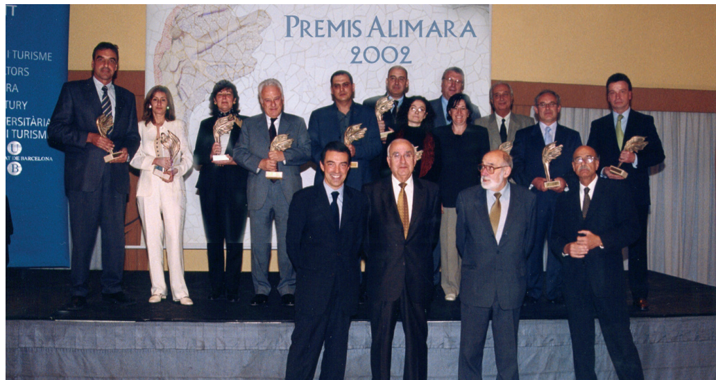
>> Concessió dels Premis Alimara.

Tres havien estat, en expressió personal, els seus impulsos vitals: «la meva fe, la vocació de servei al meu país, Catalunya, i la dedicació al món del turisme i de la formació».