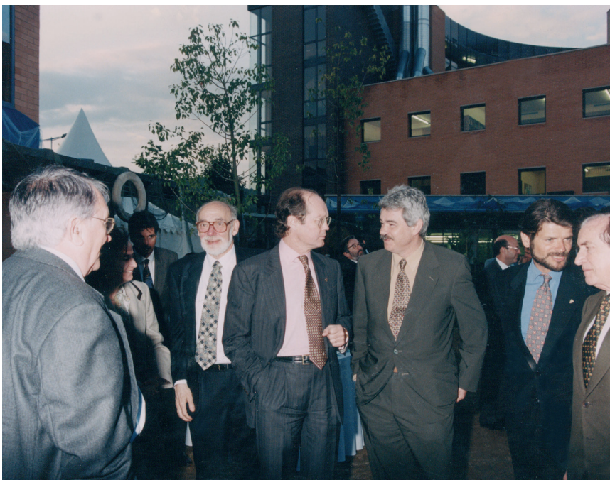
>> Inauguració de les noves instal·lacions del CETT.

El projecte de Gaspar Espuña per al CETT es caracteritzava perquè buscava ampliar la formació a tots els camps de l'activitat turística, atorgar-li un segell de qualitat i impregnar aquesta formació i la mateixa institució dels valors de l'humanisme cristià, amb un gran respecte per la diversitat ètnica, cultural i religiosa. És així com el CETT va esdevenir un grup empresarial (que també va promoure i gestionar Família Hotels), va tenir agència de viatges pròpia i va exercir una influència decisiva en l'organització d'ens a escala local (patronats, centres d'iniciatives turístiques...) dedicats a la promoció del turisme. Ara bé, l'expansió d'èxit del CETT va haver d'afrontar les limitacions de capital que li eren pròpies des de l'inici. Aviat trobà el suport dels empresaris de la Costa Brava Jordi Co-