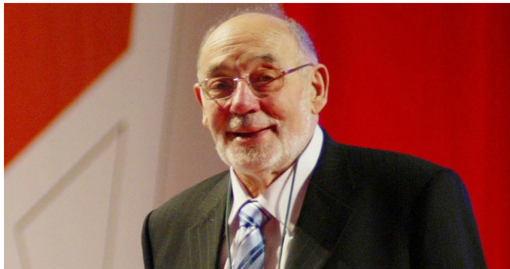
>> España després de rebre la Creu de Sant Jordi.