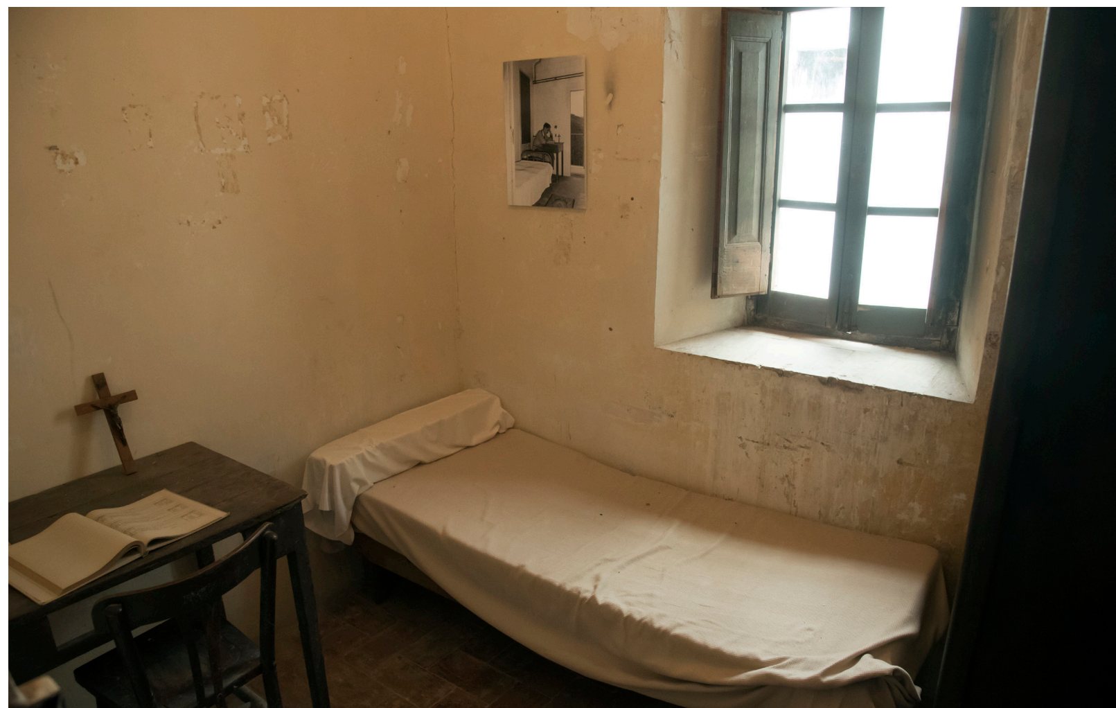
>> Una de les habitacions dels fàmuls.

D'aquesta manera, allò que havia de ser una escola esdevenia una presó. Cadascú hi havia arribat per diferents qüestions i procurava escapar-se de la vigilància dels guardians. Un dels principals objectius era esmunyir-se del tedi que comportava l'horror de la rutina, aprofitar meandres per viure al marge del món establert: robar vi de les setrilleres o de la bodega (el bodeguer, gràcies al seu estat d'etílica generositat, en deixava la porta ober-