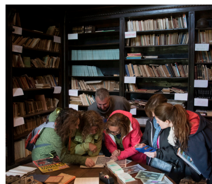
>> La biblioteca del Collèll, que els interns no van trepitjar mai i que ara es pot visitar.

fan xerrades als monitors i expliquen la seva experiència al centre. D'aquesta manera, els nous ensenyants valoren un lloc que ha tingut moltes ombres (llegenda negra) i que, al final, s'ha convertit en un espai de llum i de poderoses riallades de felicitat.