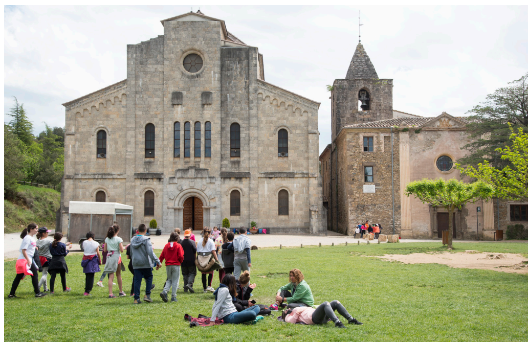
>> El Collèll actualment rep milers de nens i joves que gaudeixen de la natura i d'un espectacular escenari.