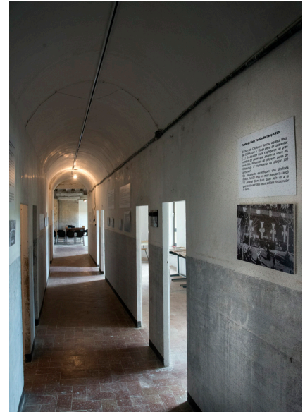
>> Museu del Collell. Es basteix a la part vella, allà on dormien i vivien els fàmuls. (Autoria: CLAUDI VALENTÍ)

ciudadana que, durant anys, el dogma catòlic va aplicar als ciutadans sense cap fre ni vergonya. Funcionava com una màquina ben greixada: els «fills de Déu» eren culpables pel sol fet d'haver nascut. El clàssic i misteriós pecat original. Regles, normes i lleis. Tot estava previst en la normativa repressora, inclús els càstigs pels mals pensaments. Era un món amb infules d'autarquia moral.