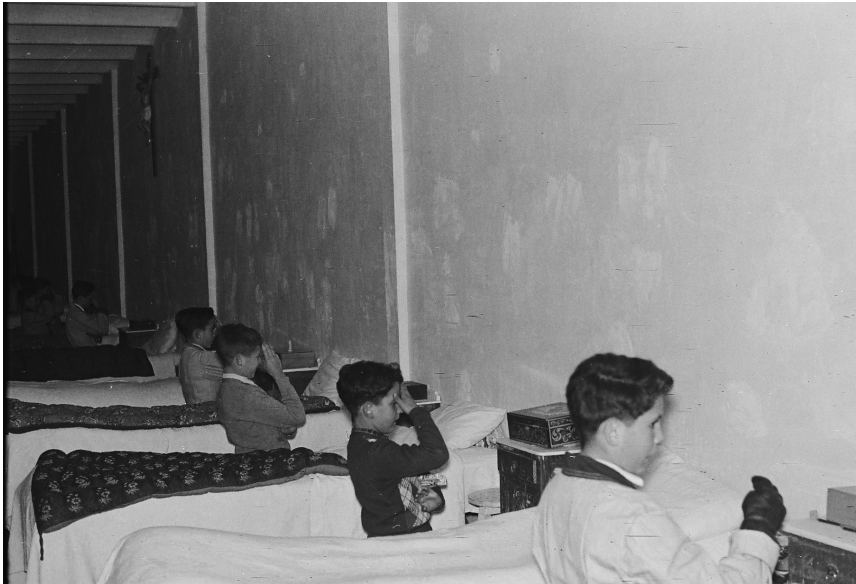
>> Un grup d'interns resant abans d'anar a dormir.