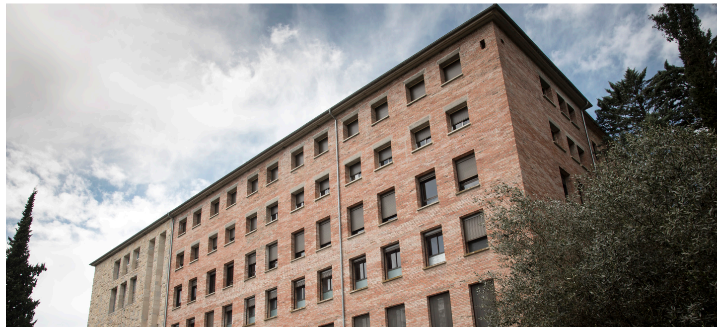
>> Labassegadora arquitectura del Collèll, severa com una fàbrica, remet a les construccions sense ànima i a la vida encaixonada rere dels maons d'obra vista. (Autoria: CLAUDI VALENTÍ)

la catòlica, no es bastia amb deures i obligacions religioses. Els mestres defugien el «perill» que els alumnes esdevinguessin ateu com a reacció en contra d'una formació religiosa estricta. L'estada mensual costava unes 50.000 de les antigues pessetes per alumne. Hi havia fills d'exalumnes amb problemes de comunicació. Fracàs escolar. La majoria provenia de famílies desestructurades. Sense ser, stricto sensu , un correccional, el centre feia aquesta funció. Es fomentava la convivència i la socialització a l'hora d'aconseguir el rendiment escolar. L'experiment es va tancar l'any 1998. L'internat havia mort.