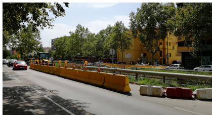
>> Obres a banda i banda del carrer Güell per fer els accessos al pont del Dimoni.

En paper, si us plau | Però la vida continua. Faran una gran carpa en forma d'igllú a la carretera de Barcelona per acollir «espectacles culturals», diu el diari. Només faltaria que fossin «no culturals»: potser boxa, mítings polítics? A Celrà, ja fa temps que la cultura té una acollida digna. Ara mateix, però, el municipi no té clar el futur de la Connexió Papyrus, un projecte de recollida i redistribució de llibres usats que des de l'any 2009 ha atret molts visitants els dissabtes. Potser canviarà d'ubicació? A Llagostera, el 2011, l'entitat Can Toni de les Eugues es va constituir amb el mateix objectiu. Ja ho deia Isaac Asimov fa quaranta anys: costarà aconseguir que les persones que estimem els llibres deixem el paper per abraçar els formats electrònics. Cal aplaudir, però, la digitalització de 1.603 pergamins originals del monestir de Sant Daniel, datats entre els segles x i xvii, que ha efectuat la UdG.