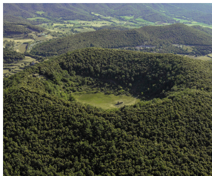
>> El volcà de Santa Margarida.

dins allotja una capella d'origen romànic dedicada a la santa que dona nom al volcà. Ara la preservació n'està assegurada, així com les millores necessàries per reordenar l'ús públic i evitar-ne l'erosió, accions imprescindibles per a la sostenibilitat de l'entorn.