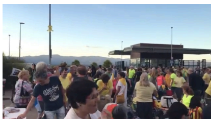
>> Moments previs al sopar davant la presó de Figueres el 14 d'agost.