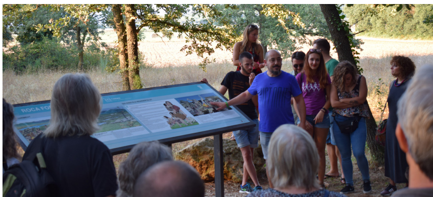
>> Un moment de la visita guiada del 10 d'agost al jaciment de Roca Foradada.

Lloret: Ribalau recuperat | Constantí Ribalau i Vert (1888-1952) va ser un lloretenc que va anar de jove a l'Havana, va treballar a la taverna La Floridita dels germans Sala Parera i va tenir de company Miquel Boadas Parera (1895-1967), fill d'emigrants que ja havia nascut a Cuba. Ambdós van fer famosa aquella cocteleria. Boadas, al cap d'uns anys, tornà a Catalunya i va crear el Boadas Cocktail Bar, una autèntica institució a la ciutat comtal. Ribalau, a l'Havana, va tenir un client excepcional, Hemingway, que va ser un entusiasta dels seus daiquiris i el va