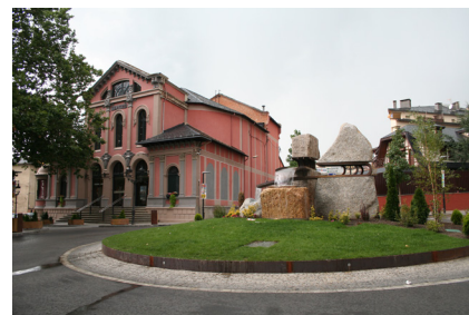
>> La plaça de Barcelona i la Casa Gran de Puigcerdà.

ha seguit invertint en l'arranjament de la vila i l'augment del seu patrimoni cultural. Al castell habilitat per a les visites, cal afegir-hi els treballs d'excavació que es duen a terme a la part baixa del turó, on s'ha pogut localitzar el fòrum romà, just a tocar de l'església. Aquesta intervenció ha estimulat la creació d'un projecte de millora de l'espai que envolta l'església de Nostra Senyora dels Àngels, ja que ara mateix queda amagada rere els arbres i tant l'accés per les escales com el voltant de l'edifici estan força degradats. El projecte de millora preveu crear una zona enjardinada davant l'església i la millora dels accessos. L'objectiu final serà donar més visibilitat i protagonisme a l'església, així com unir aquest espai amb el del fòrum romà, on actualment treballen els arqueòlegs. Així doncs, Llivia segueix estudiant el seu passat i compartint el seu patrimoni cultural i arqueològic amb tots aquells que s'hi acosten.