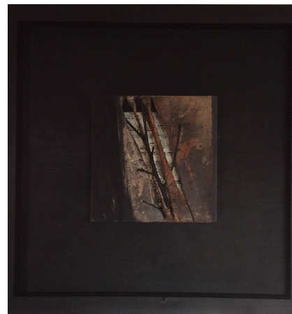
>> Sonata: emoció i silenci. Mixta i collage, 30 × 30.

de l'incendi, i els més càlids, que els contraprogramen. El resultat? Bandes verticals inestables, en què la veritat de la terra es baralla amb l'altra veritat, la del foc, la de l'incendi, la que no es pot dominar, una al costat de l'altra, en equilibri precari, la renaixença, els brots, l'esperança. I sabeu? L'art i el domini màgic rau en aquest moment en el fet que els colors i els gestos s'assemblen, l'artista que sap i el públic que vol saber. Seria fàcil i estúpid admetre que la fotografia d'un bosc cre-