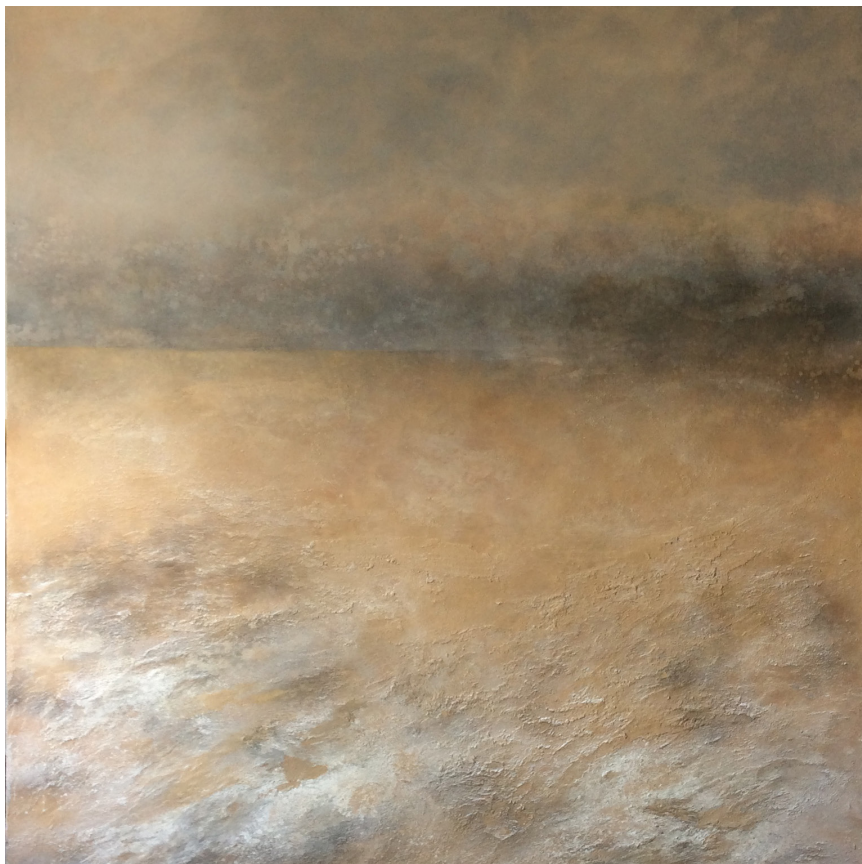
>> Miratge, 2016. Acrílic sobre tela, 200 × 180 cm.

la convidava a la vora de les Guillerries feréstegues i inconegudes.