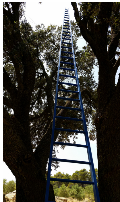
>> Escala, 2015. Acer patinable, 6 metres d'alçària. La Pobla de Cêrvoles.