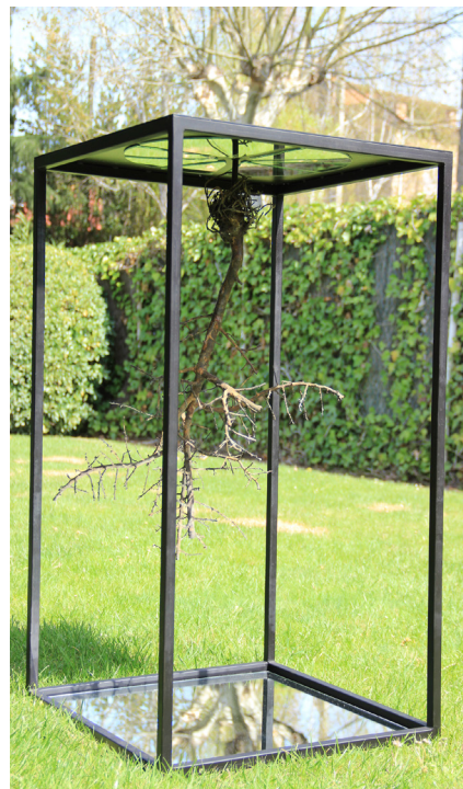
>> Existència infinita, 2018. Arbre en bronze, estructura en ferro i miralls, 100 × 60 × 80 cm.

L'obra de Mateu giravolta, sovint, en un foc d'encenalls primigeni, el bosc cremat, que ha estat el títol d'una extensa i fèrtil exposició al museu Würth, a Agoncillo (la Rioja), una exposició molt ben documentada en què el procés creatiu interpel·la sense contemplacions el públic i en què l'artista té carta blanca per experimentar, per reconduir experiments anteriors, per revisitar certes es i (és necessari) per indagar o enllepolir i adobar la profunditat de les arrels on ha anat pouant la seva interrelació amb la naturalesa, que en el seu cas potser cal anar a buscar en els set primers anys viscuts a Cassà de la Selva, o quan l'avi l'endinsava amb un carretó en el món de les collites o en els estius que l'amiga