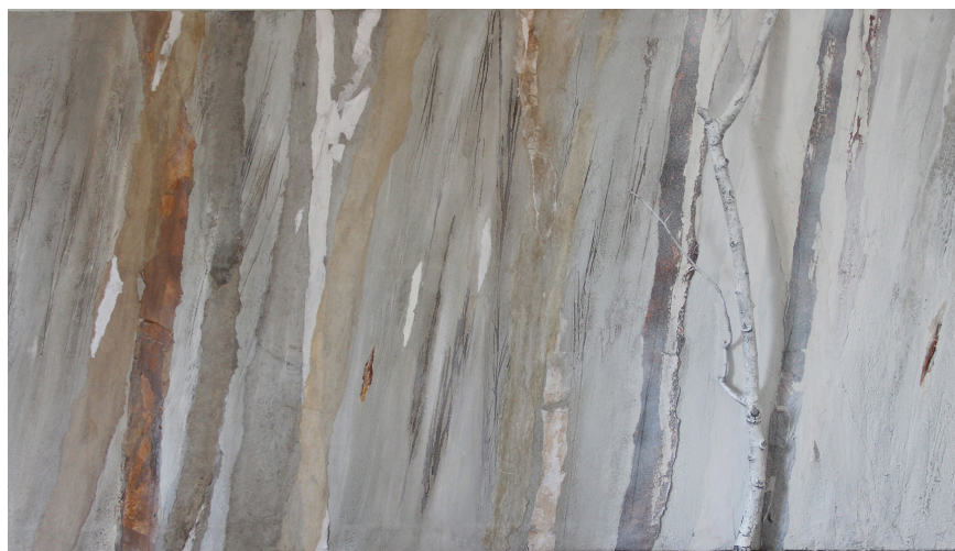
>> L'ombra blanca. Mixta i collage sobre tela, 97 x 195 cm.