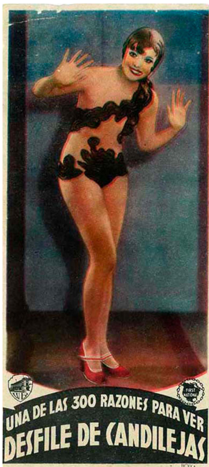
>> Joan Blondell en un programa de Desfile de Candilejas.