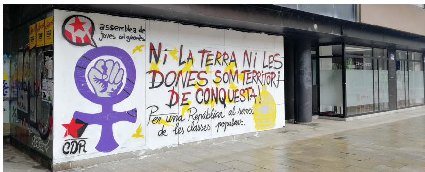
>> Mural representatiu de les reivindicacions del 8-M a Girona. (Autoria: DANI VIVERN)

L'art urbà | L'artista B-Toy ha creat una pintura de grans dimensions en una paret lateral del Museu dels Sants d'Olot. És una de les deu artistes comissariades per l'Associació Rebobinat dins del projecte «Womart», guanyador del Concurs de Comissariat impulsat l'any 2017 pel Consorci Transversal Xarxa d'Activitats Culturals. El projecte agrupa deu ciutats catalanes amb la voluntat de fer-hi visible l'art urbà fet per deu dones, que es vol valorar especialment, ja que massa sovint el talent artístic de les dones creadores ha estat silenciada. En aquest mural la seva creadora, que ha fet pintures murals de grans dimensions en ciutats d'arreu del món, s'ha inspirat a partir del rostre d'una treballadora del taller d'imatgeria religiosa, ubicat en el mateix edifici del Museu dels Sants, i fa un homenatge a les treballadores dels tallers de sants d'Olot.