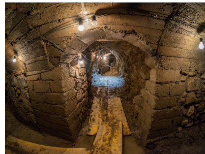
>> Túnel del subsol del passeig del 10 d'Abril de Puigcerdà.

Aquest estiu, els túnels s'obriran al públic, i aquesta acció permetrà explicar una part més de la història de la vila. És una iniciativa per ampliar i difondre el patrimoni cultural puigcerdanenc.