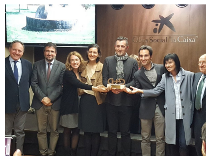
>> Els principals representants de la Fundació Autisme Mas Casadevall rebent el premi CERMI 2017.