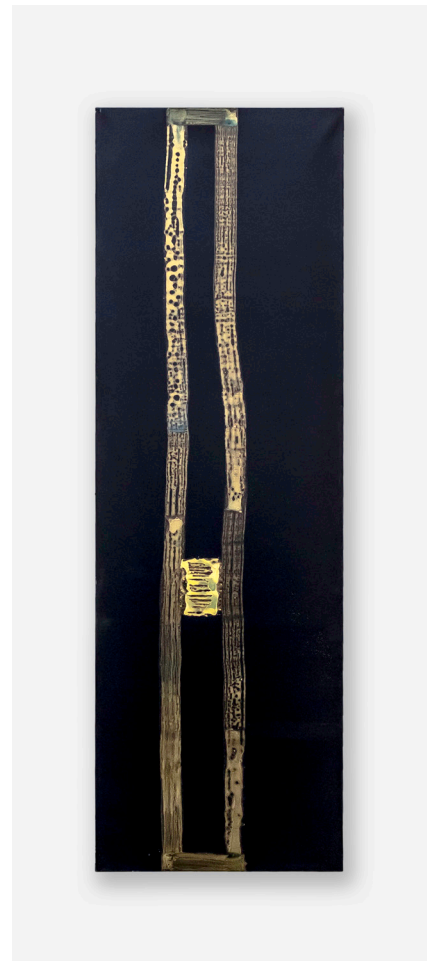
>> Sense títol, 1994, acrílic sobre tela, 200 × 80 cm.