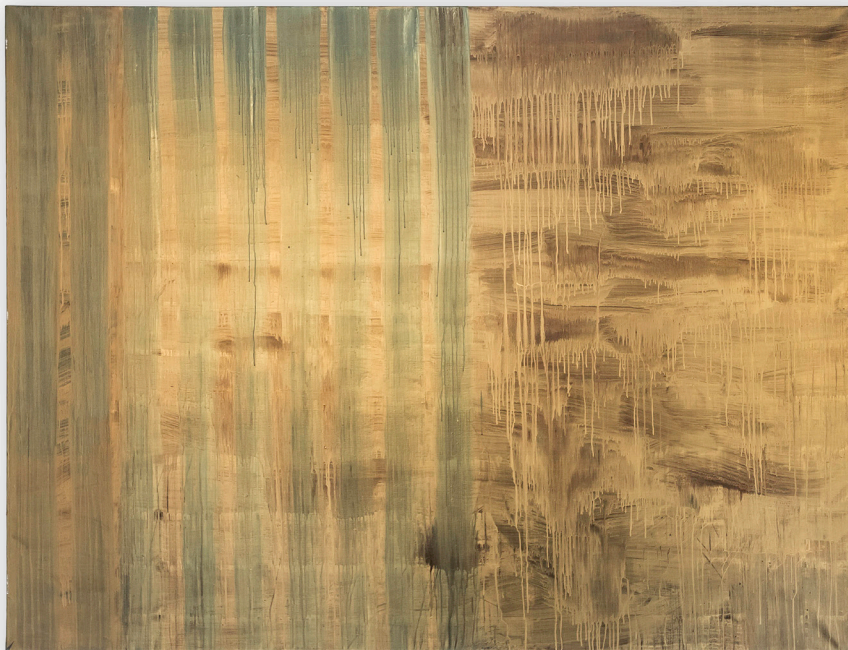
>> Sense títol, 1992, acrílic sobre tela, 170 × 200 cm.

gestualitat directa, aparentment descontrolada, però sempre en una direcció creativa: la revisió dels esclats més amagats, més vinclats, potser insinuats, dels abismes de l'alfa i l'omega, potser allò que no ens és revelat si no és en forma artística, en arts plàstiques, musicals o en literatura.