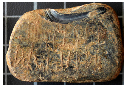
>> L'objecte de plom amb inscripcions localitzat a Ullastret.