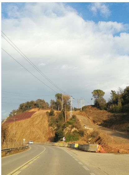
>> Obres a l'N-141e, a la Pilastra, a l'entrada est de Bescanó.

A Celrà encara estan valorant el cas de la seva variant (que si ha de passar o no pel polígon), i mira que allà l'orografia és força més favorable que Bescanó a les alternatives. Mentrestant, a Flaçà, tot i alguns entrebancs amb els trens (què se'n pot esperar avui, dels trens, en aquest país?...), continuen sense aquesta mena de problemes, gràcies a la felicitat circumstància que la carretera principal no els ha passat pel mig.