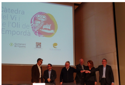
>> Presentació de la Càtedra del Vi i de l'Oli a Figueres.