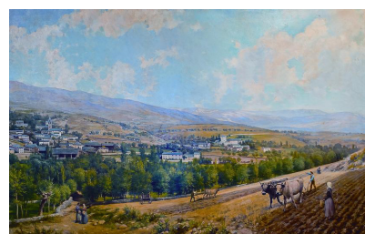
>> Vista de Bolvir, quadre de Pere Borrell.

Aquesta obra formarà part de la col·lecció de l'Ajuntament de Bolvir i es podrà visitar a la sala de plens.