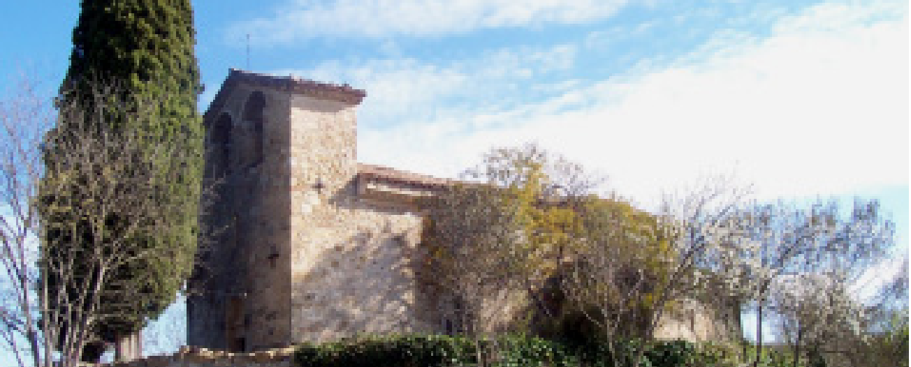
>> Església dels Sants Just i Pastor. Veïnat de Pedrinyà (Crespià).

poble havia de tenir-ne, governades per un alcalde o batlle, amb un consell de regidors i amb la tutela dels poders borbònics. Però aquest model castellà no havia suprimit l'Antic Règim, que donava atribucions als senyors acomodats dels pobles per nomenar els batlles del seu municipi.