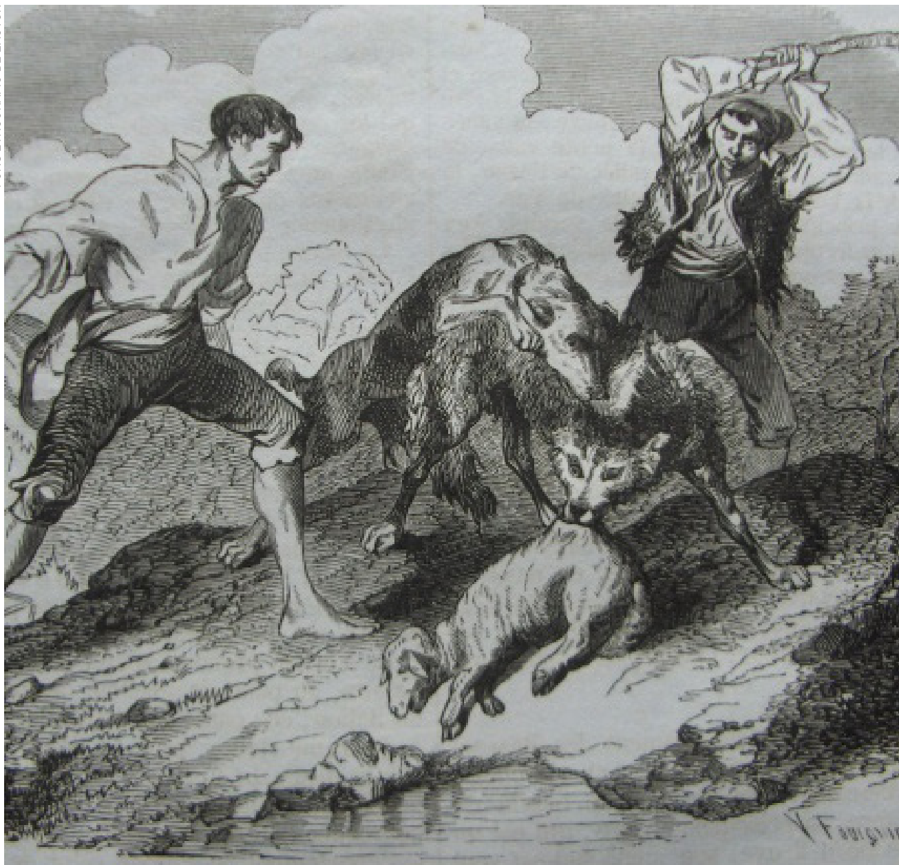
>> Atac del llop a una ovella. Retall d'una publicació occitana de l'any 1855.

plegat, van redactar una nova cèdula, el 1795, a partir de la qual quedaren suprimides les batudes, i es va acabar optant per doblar la quantia de les recompenses per a qui matés llops.