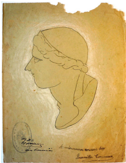
Fundació Rafael Masó