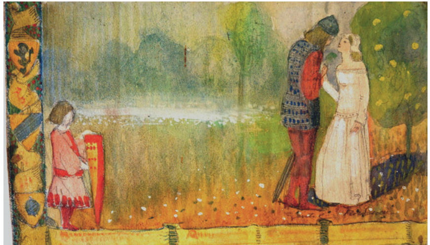
Fundació Rafael Masó