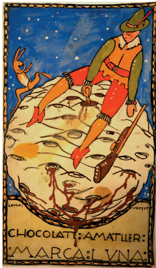
Fundació Rafael Masó