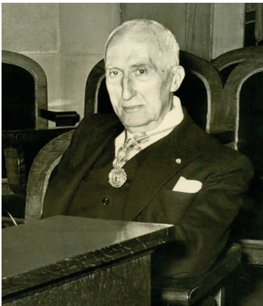
REAL ACADEMIA DE CIENCIAS ECONÓMICAS Y FINANCIERAS (RACEF)

Rafael Gay de Montellà és un dels pocs autors que apareix a la secció «Clàssics Revisitats» que no va néixer en aquesta província: la raó, de pes, la trobem en el títol de la novel·la, Girona, 1900 . Nat a Vic l'any 1882, Gay de Montellà va estudiar el batxillerat a la ciutat dels quatre rius. Després de publicar unes quantes obres de referència en l'àmbit del dret mercantil, va veure la llum aquesta única obra de ficció quan l'autor ja era octogenari, el 1966, tres anys abans de morir.