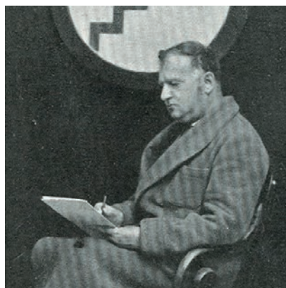
>> Francesc Pujols.

Deulofeu divideix els exiliats en tres grups: els paràsits, que viuen de les ajudes oficials; els explotats, que no han pogut eludir els camps d'internament; i els actius, que, com ell, han aconseguit mantenir-se a si mateixos treballant. L'actitud de Deulofeu és de curiositat positiva: ja que es troba separat del seu país i de la seva família, mira de viatjar i aprendre noves feines. Fa tertúlies amb Pompeu Fabra, amb Francesc Pujols, amb Pau Casals, però sobretot aprofita els viatges per comprovar les seves teories sobre la Matemàtica de la Història, que perfecciona durant els anys d'exili. Aquestes pàgines de les memòries són una lliçó de vida: Deulofeu s'extasia davant dels paisatges, aprèn a tocar el saxofon, s'ofereix a treballar d'hortolà... No vol arrelar ni avorrir-se, sinó créixer. El seu