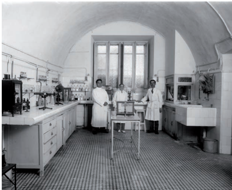
<< Laboratori de l'Institut Municipal d'Higiene de Santa Caterina, testimoni de la modernització registrada durant el primer terç del segle xx

Fins al 1880 no hi ha una disposició que prohibeixi explícitament l'acolliment de pobres als hospitals, i va ser a partir de mitjan segle XIX quan començà l'atenció especialitzada