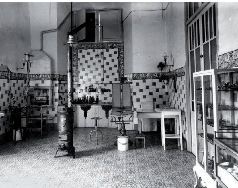
<< Sala de consulta de l'Hospital en els anys vint. S'hi observa instrumental i aparells que denoten la introducció de certa tecnologia a la funció mèdica.

AJUNTAMENT DE GIRONA. CRDI (VALENTÍ FARGNOLI I ANNETTA)