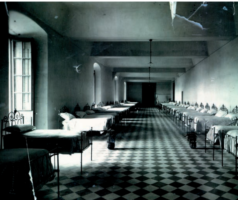
<< Sala col·lectiva de malalts de l'Hospital, abans de la divisió dels espais en habitacions. Cap a l'any 1920.

llar i que tenien cura de les hortes per abastir els establiments de beneficència. La decisió va portar a l'experiència pionera de colònia-asil, fet que reduí molt la despesa. Al mateix temps allò va ser l'origen del Parc Hospitalari Martí Julià, que es fundaria un segle més tard en aquells terrenys del mas Cardell.