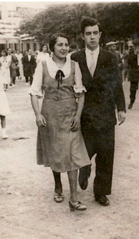
AMCS / FONTS ENRIC GENOHER