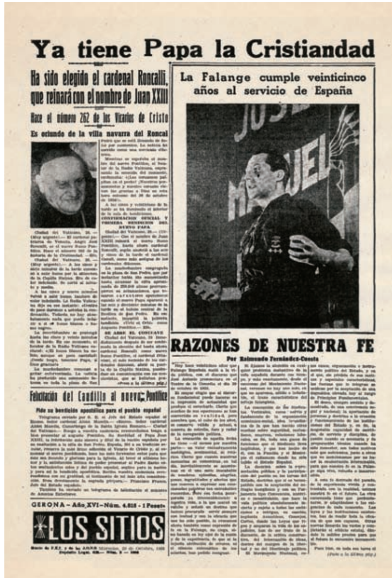
>> Primera pàgina del diari Los Sitios del 29 d'octubre de 1958.

Arribats al 29 d'octubre de 1958, vint-i-cinquè aniversari de la fundació de la Falange, els periodistes gironins es van trobar amb un conflicte d'interessos que havia d'acabar en una grotesca col·lisió. El dia abans a la tarda, mentre les campanes dels temples gironins efectuaven el « Repique general » que anunciava l'inici oficial de les Fires, els cardenals de l'Església catòlica reunits a Roma elegien el successor de Pius XII, el papa —i avui sant— Joan XXIII. La notícia, com era obvi, havia de sortir destacadament a la primera pàgina. El diari, però, no volia —o no podia— renunciar a la seva efemèride. La solució d'un dilema que per a ells devia ser tan greu va ser maquetar una portada amb una combinació maldestra, digna de passar a l'antologia dels pitjors disbarats periodístics. La capçalera del diari va quedar relegada al lloc més inhòspit: a baix de tot, a la part inferior esquerra. Pel que fa a la resta, la imatge que reproduïm val més que mil paraules. Podem dir només que el lector apresat que va consultar el diari aquell matí, en conjugar el titular de dalt de tot amb la gran fotografia col·locada sota seu, va poder creure, per un moment, que els purpurats de Roma havien elegit com a nou Pontífex José Antonio Primo de Rivera.