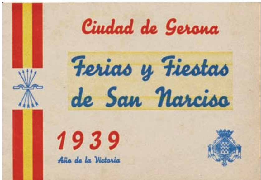
>> Portada del Programa Oficial de Festes de 1939.

Això condemnava la ciutat a prescindir durant molts anys de la data central de la seva Festa Major, i a introduir una estranya jornada de dol enmig de l'ambient festiu de les Fires. Afortunadament, va prevaldre el sentit comú: després de múltiples gestions, que van durar quasi un any, el Ministerio de Gobernación, amb data 14 d'octubre de 1940, va dictar un decret que, excepcionalment, concedia a Girona la facultat de traslladar el Día de los Caídos al