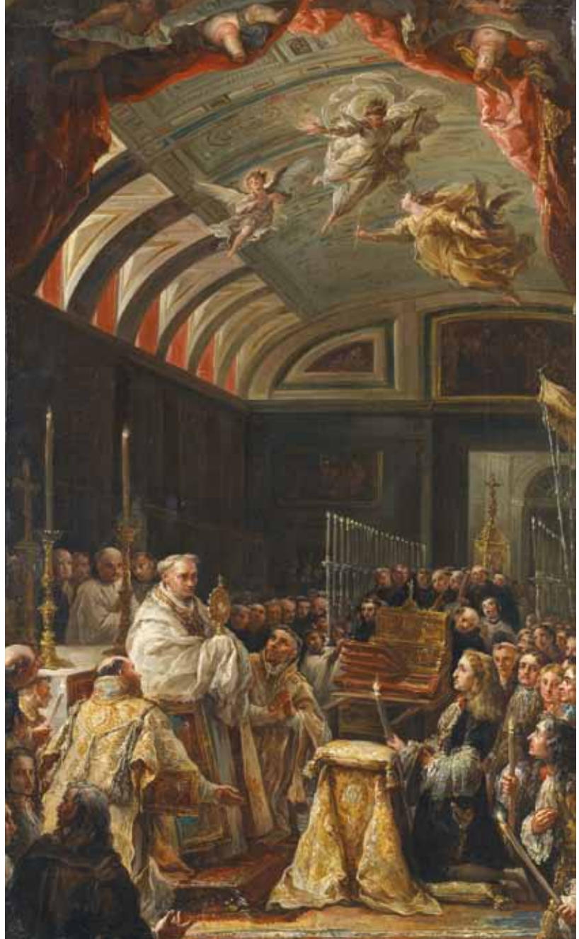
MONASTERIO DE SAN LORENZO DE EL ESCORIAL