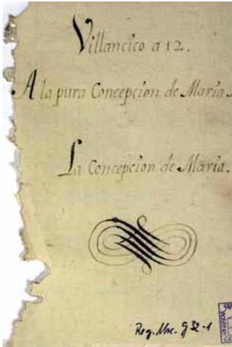
>> Portada d'una partitura de Gaz, força deteriorada.