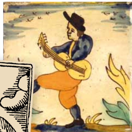
>> Rajola amb un músic guitarrista i, a l'esquerra, la mulassa de Girona.

Al vespre fou el torn de les alimares, que volien convertir la nit en dia amb atxes i lluminària. Van ballar els gegants, la mulassa i l'àliga i gitaren coets la mulassa i els dracs. Dalt de cadafals, quatre cobles van sonar la «Lloança a les glòries de Carlos III».