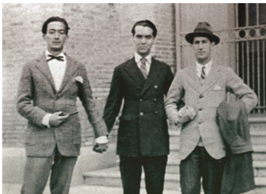
ARJÚ PERE VEHÍ

Quan, el 1931, Salvador Dalí pintava La persistència de la memòria —aquell quadre que tots coneixem com Els rellotges tous — ja sabia que la seva personalitat (humana i artística) romandria intacta en un hiperpresent continu i amb un interès idèntic al cap de vint-i-cinc anys de la seva mort. Que la seva obra pictòrica és d'una vigència radical, no en tenim cap mena de dubte: només cal anar un dia qualsevol al Teatre-Museu Dalí de Figueres. Dalí serà sempre Dalí, l'únic i d'interès universal. Però afortunadament es comença a reivindicar amb la força que es mereix la seva faceta com a escriptor. No ens ho inventem: ell mateix ja ho va deixar ben clar quan va dir allò de «sóc més bon escriptor que pintor», i el seu amic García Lorca ja va augurar la missió literària al pintor en diverses ocasions. En homenatge a aquest quart de segle sense la seva presència física, han aparegut diversos llibres que volen obrir el personatge cap al terreny del pensament, la filosofia i l'escriptura. No parlem d'una afició menor. El llegat de quasi nou mil pàgines escrites per l'autor de la novel·la Rostres ocults és una mostra de la seva «llibertat mental extraordinària», en paraules de Josep Pla, i és, per damunt