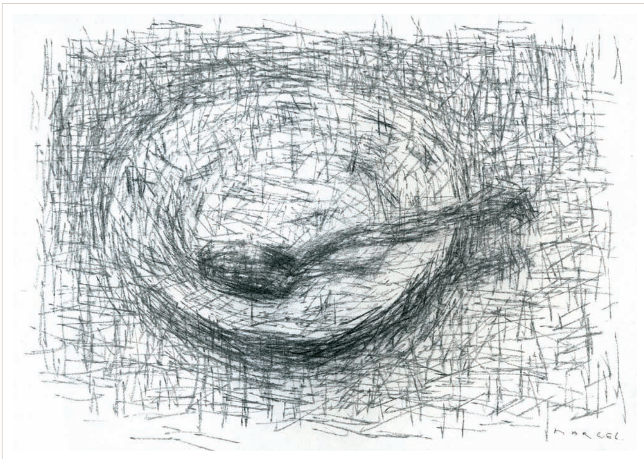
Cullera (2009), llapis carbó sobre paper, 21x30 cm.

Recorda que sempre li havien dit que sabia dibuixar, i de fet era l'única matèria que li interessava de l'escola. El dibuix el fascinava. Ja llavors deia que quan fos gran volia ser dibuixant. Tot i ser adolescent, la seva determinació era tan ferma que els seus pares als dotze anys el van apuntar a un Curso de Dibujante General de la CEAC, una editorial especialitzada a donar coneixements i títols per correspondència. Aquella determinació va ser modificada amb els pas dels anys malgrat que mai no ha deixat de dibuixar. Molts dels treballs fotogràfics sovint eren concebuts a partir del dibuix, però eren usos laterals, marginals, d'aquesta disciplina. No ha estat fins fa pocs anys –a partir del 2008– que va decidir reprendre el dibuix com a activitat central de la seva vida. No recorda haver practicat mai cap activitat d'una manera tan intensa i continuada. Diu que no sols és el seu darrer treball, al qual dedica moltes hores diàries, sinó que assegura que serà el darrer