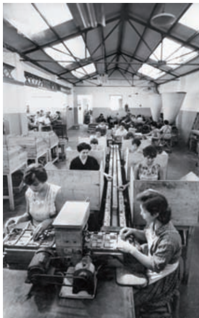
>> Interior de la fàbrica Oller en els anys quaranta del segle xx.