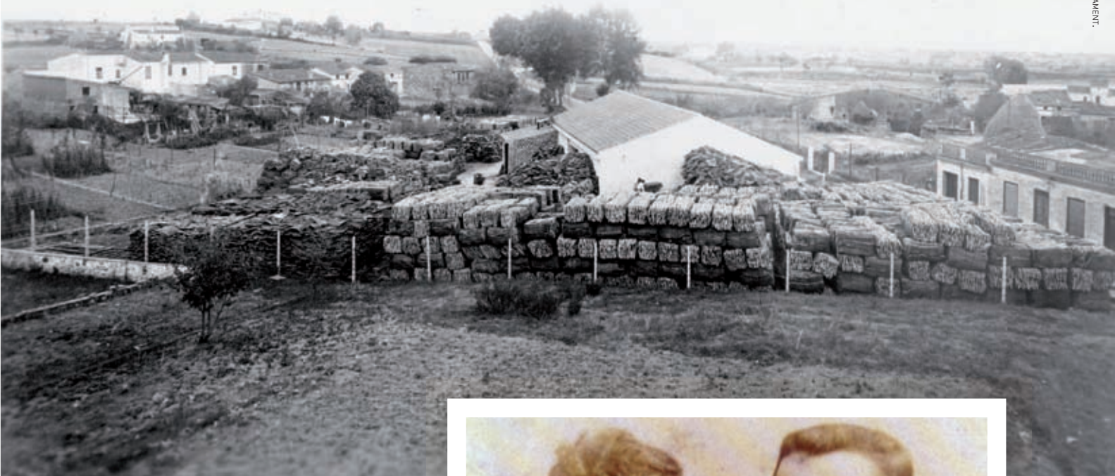
>> Vista general de la fàbrica Oller en el carrer de Marina, de Cassà de la Selva, en els anys trenta del segle xx.

Per sort, Francisco Oller coneixia un ofici, el de taper, i el 1885 emigrà, primer a la Llombardia, després a Tolosa, i finalment a la Xampanya, on es trobà amb altres gironins. No es tornen a tenir notícies de Francisco Oller fins al 1891, ara ja a Épernay, on era l'encarregat de vendes de la sucursal del taper de Llagostera Jaume Coris.