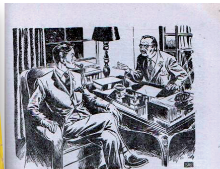
Tengo entre manos un caso extraño