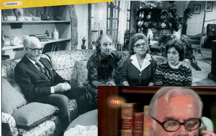
>> Una novel·la policíaca signada per Lartsinim i dues imatges de la sèrie Doctor Caparrós, medicina general, interpretada per Joan Capri i amb guió de Ministral.