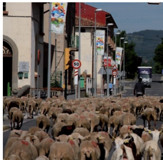
>> El camí ramader passa per Campdevàrol, al