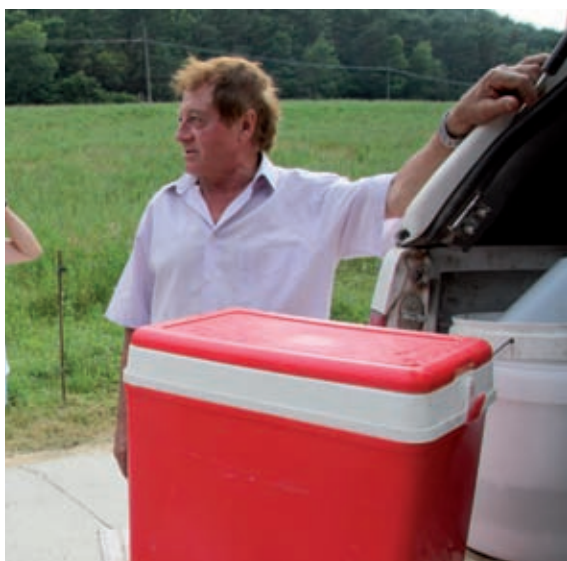
durant una de les pauses.