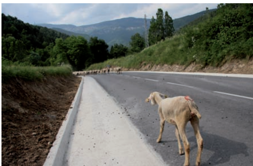
>> Si algun animal té problemes, serà carregat en el vehicle tot terreny.