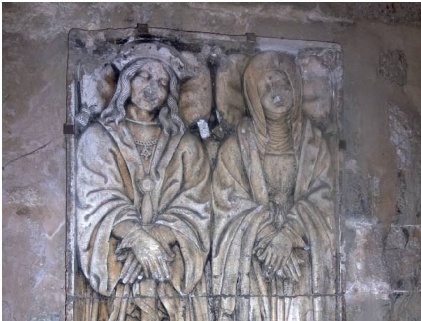
>> Lauda sepulcral de Ferran de Joara i Tímbor de Cabrera.