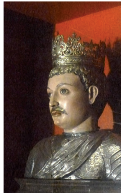
>> Bust reliquiari de sant Iscle.

la durant el mandat del primer (1461-1507), que també va ser president de la Generalitat entre 1470 i 1473.