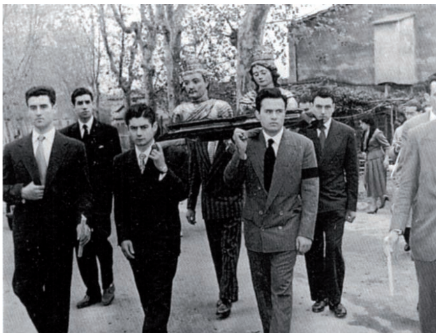
>> Processó amb les relíquies dels patrons de Breda.