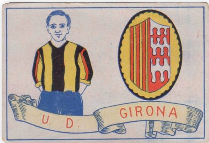
>> Anvers i revers d'un cromó d'«Unió Deportiva Girona» de xocolates Amatller de l'any 1929.

en aquesta època la Unió Esportiva Girona, formada en part per membres del Centre Gironenc, continuador del dissolt Strong. El club es va convertir en el més poderós de la ciutat, i va construir l'estadi de Vista Alegre el 1922. L'equip vestia els colors groc i blau marí. Va desaparèixer al final de la dècada per problemes econòmics.