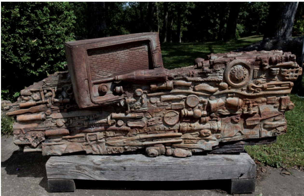
Estrats horitzontals (1987). Refractari patinat amb òxids. 60 x 140 x 32 cm.

un mos i es tancava als caputxins a fer ceràmica i també esmalts sobre coure fins a altes hores de la nit.