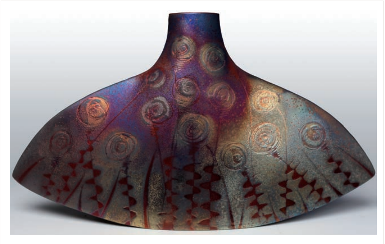
Sense títol (2011). Argila ferruginosa amb esmalts de reflex metàl·lic. 38 x 70 x 13 cm.