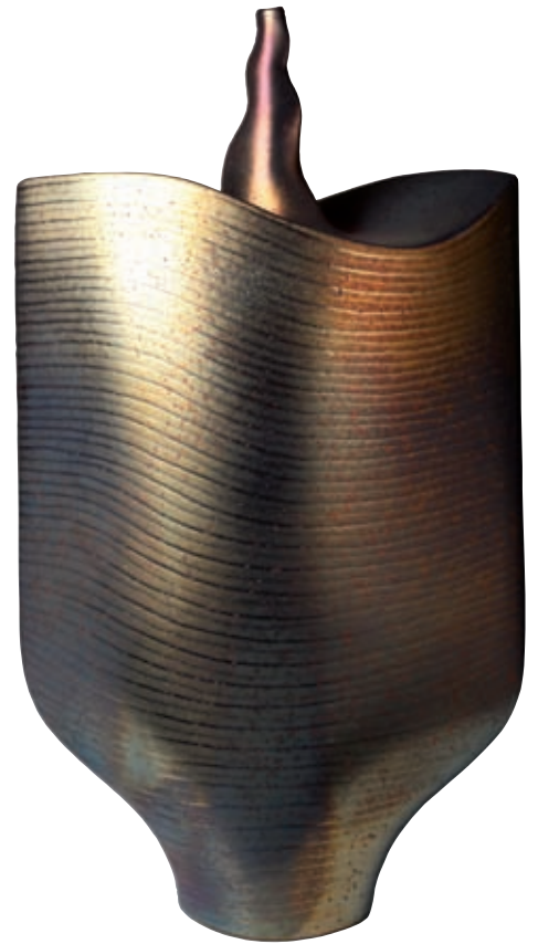
Pell d'àngel , 2011. Argila ferruginosa amb esmalts de reflex metàl·lic. 72 x 36 x 15 cm.

> S'ha convertit en un dels màxims exponents de tot el país pel que fa a la ceràmica de reflexos metàl·lics